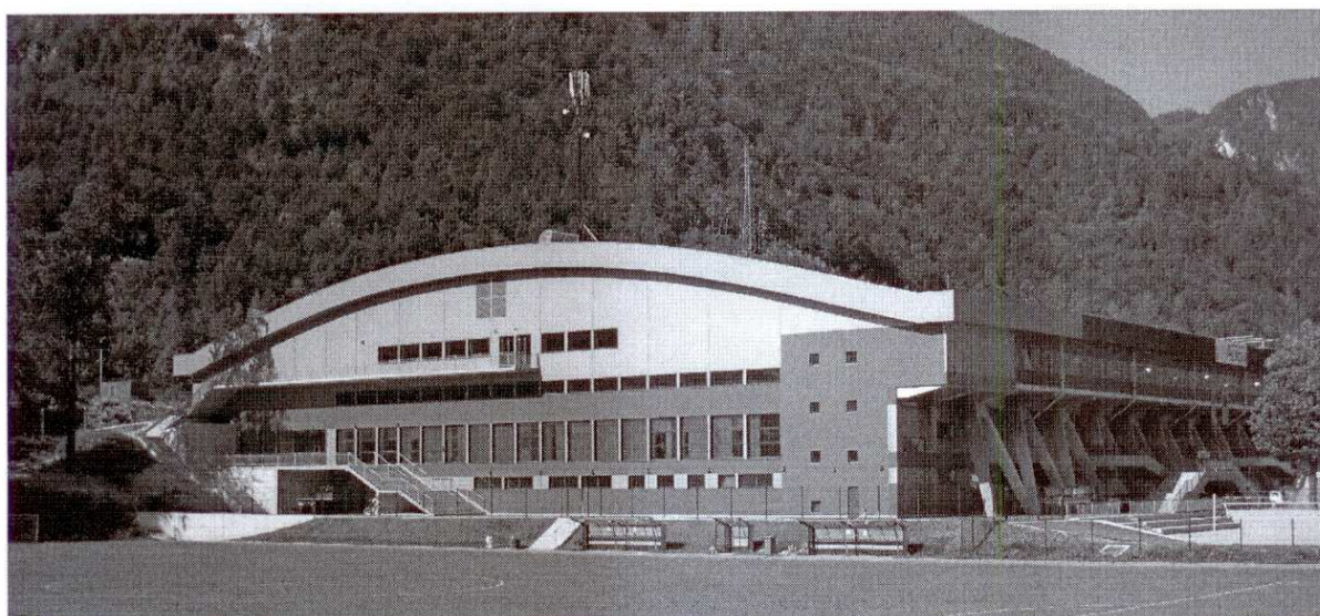
Vir: arhiv Občine Jesenice, Športna dvorana Podmežakla, avgust 2011

Že zgrajena Športna dvorana Podmežakla, ki predstavlja pomemben del športno – rekreativno – turistične ponudbe tako za Občino Jesenice, kot tudi za širšo okolico, je namenjena za izvajanje športov na ledu (hokej, umetnostno drsanje, kegljanje na ledu, rekreativno drsanje), namizni tenis, za rekreativne programe, kot so fitness, telovadba, aerobika za različne ciljne skupine, ter za različne prireditve.