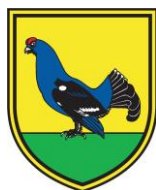
Občina Kranjska Gora