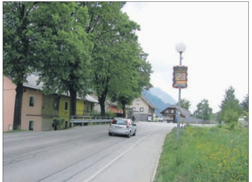
Radarska tabla bo na tem mestu na Hrušici približno tri mesece.