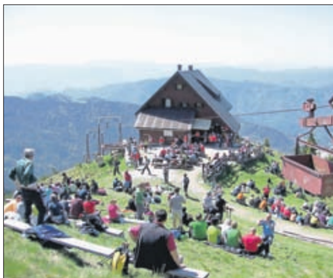
Pravo invazijo je doživela Golica že prvi vikend v maju, ko se je nanjo povzpelo več tisoč ljudi.

SVETI KRAJEVNIH SKUPNOSTI STANETA BOKALA MIRKA ROGLJA-PETKA CIRILA TAVČARJA Tavčarjeva 3/b, 4270 JESENICE