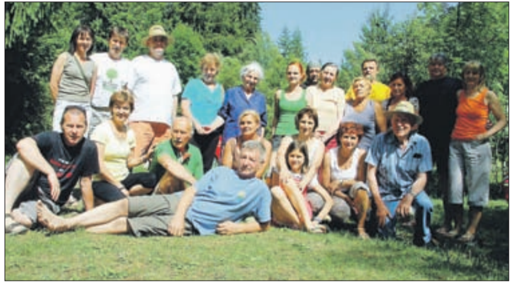
Tradicionalnih srečanj bivših in sedanjih stanovalcev Ceste revolucije 9 se udeležujejo vse generacije.

Prejšnjo nedeljo, prav na polulano Zofko, bi morala potekati zanimiva prireditev PodGolico.si - ekipno kolesarjenje po gorskih poteh, ki se vijejo med travniki, polnimi narcis, po trasi, dolgi 50 kilometrov s kar 1250 metri vzponov! A zaradi katastrofalno slabe napovedi vremena, ki je obljubljala celo sneg v višinah, na katere naj bi se povzpeli kolesarji, je bil organizator DRT Deveta REVOLUCIJA kolesarjenje za pokal Jeklene ključavn'ce prisiljen odpovedati oziroma prestaviti; vodja prireditve Andrej Zalokar je obljubil, da bo tekma 29. maja, ko bo zanesljivo spet sonce.