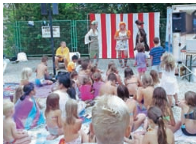
Ob spominskem dnevu Občine Jesenice je potekala Gusarska zabava.