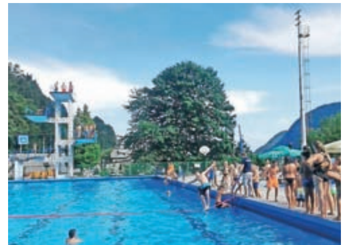
V avgustu so dejavnosti namenjene predvsem osvežitvi na Kopališču Ukova.