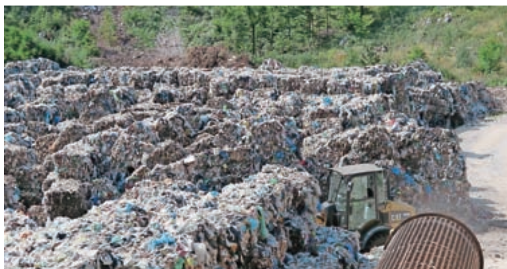
Večji problem so zdaj bale tako imenovane lahke frakcije, ki jih bodo izvozili, s tujim prevzemnikom so blizu končnemu dogovoru. Na odvoz čaka kar deset tisoč ton bal.