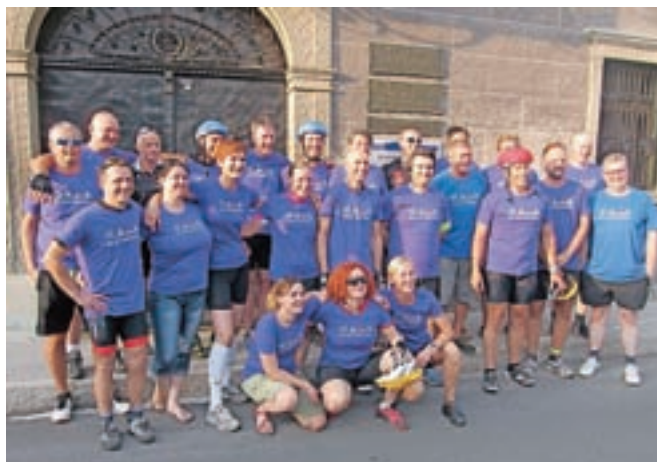
Maxovci na startu ...

Z Jesenic so se maxovci odpravili v sredo, 9. avgusta, ob 19. uri in s tem začeli