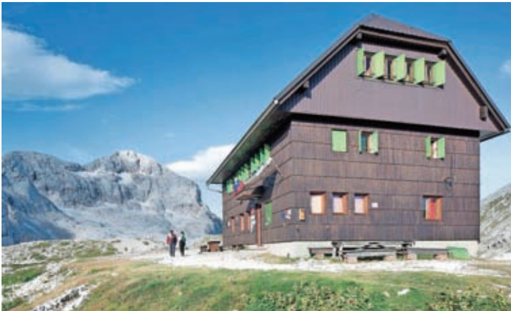
Staničev dom letos čaka sanacija odpadnih voda iz koč.

ter ravnanju z odpadnimi vodami. Največji letošnji gospodarski zalogaj je obnova suhih dehidracijskih stranišč na Staničevem domu. V avgustu so tja prepeljali dvanajst ton gradbenega materiala, ki ga bodo porabili za obnovo stranišč in s tem opravili večji del sanacije odpadnih voda koč.