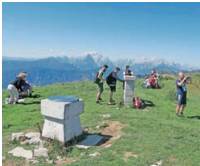
Avgust in september sta čudovit čas tudi za vzpon na vrh Golice.

kah. »Ker smo pri društvu ponosni na generacije marljivih in zagnanih ljudi, želimo zgodovino in njihove zasluge ohraniti za sedanje in prihodnje rodove. Na ta dan bomo zato uradno ustanovili zgodovinski odsek pri društvu in v koči pripravili priložnostno razstavo,« je povedal Rabič. Za dobro razpoloženje bo skrbel ansambel Ex Trio 3 s pevko. Ob tem pa pri Planinskem društvu Jesenice, kjer skrbi jo za vse planinske poti, ki vodijo na Golico, vse planince in druge obiskovalce gora opozarjajo na previdnejšo hojo na poti od Fenca v Planini pod Golico do spodnje postaje tovarne žičnice. Zaradi gradbenih del za vodovod so društveni markacisti del poti preusmerili in namestili nove oznake.