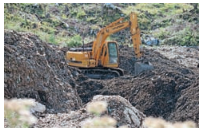
Stanje v CERO Mala Mežakla v torek dopoldne: šest zaposlenih dela s polno paro, tedensko predelajo okrog štiristo ton uskladišenih odpadkov, v kupu naj bi jih bilo še manj kot dva tisoč ton. Do konca septembra bo kup saniran, zagotavljajo.

Težave pa imajo tudi z izvozom tako imenovane lahke frakcije na sosežig v tujino. Izvozno dovoljenje sicer že imajo, a v cementarni v Avstriji, kamor so jih prvotno namenjavali odvažati, imajo zapolnjene vse zmogljivosti. Tako so zdaj začeli iskati druge možnosti in po zagotovilih so že blizu končnim dogovorom z drugim tujim prevzemnikom, je povedala Tea Ulaga. Da predelava odpadkov poteka s polno paro, smo se prepričali tudi sami v torek dopoldne.