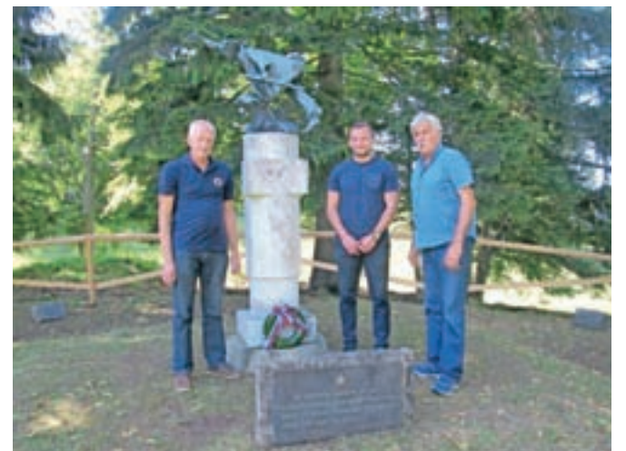
Delegacija pri spomeniku na Obranci