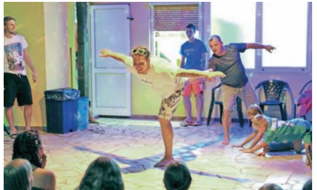
Večeri so namenjeni tudi zabavi in zabavnim igram, kjer sodeluje cel kamp.