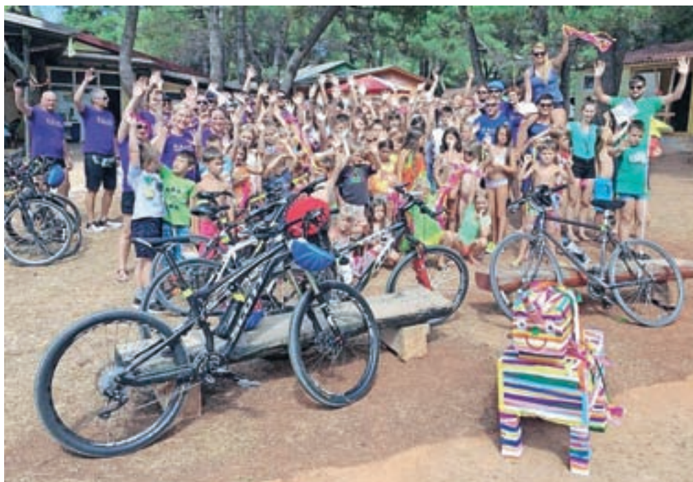
... in na cilju v Pineti

tokratno pustolovščino. Ta ima vsako leto tudi humanitarno noto, saj udeleženci s potjo v Pineto simbolično dostavijo sredstva za letovanje socialno ogroženih otrok, zbrana na teku Jesenice tečejo, dobrodelno dražbo in drugimi aktivnostmi. Pot maxovcev je tokrat trajala dobra dva dni, saj so v Pineto uspešno in brez hujših zapletov – z le nekaj gumidefektov – prispeli v petek dopoldne. Utrujeni, z novo izkušnjo, novo avanturo in še trdnejšim prijateljstvom.