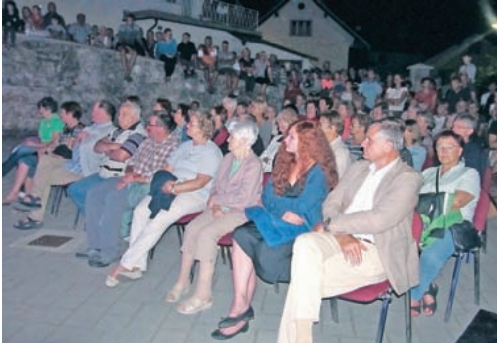
Spominska slovesnost pri farni cerkvi

Sklop prireditev se je začel 14. avgusta s spominsko slovesnostjo Večer na vasi pri farni cerkvi. Številnim navzočim prebivalcem je o do-