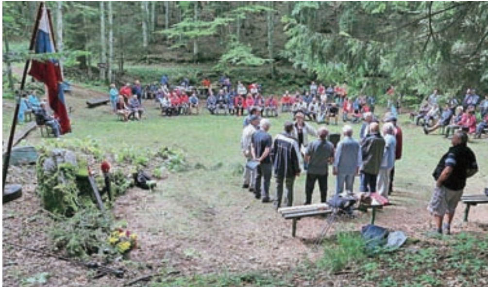
Na Zakopu na Mežakli s kulturnim programom in druženjem počastijo spomin na dogodke iz druge svetovne vojne.