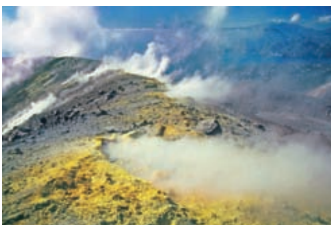
Ognjenik