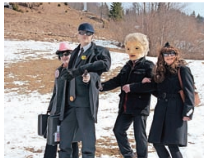
Trump in Seku-Riti