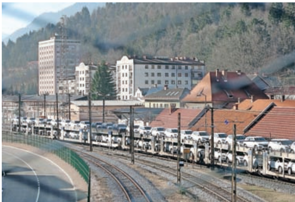
Utrinek z Jesenic