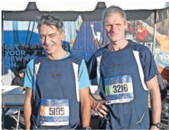
Pred startom