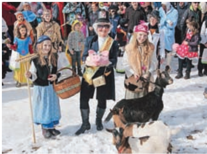
Sladko svinjsko glavo sta med otroškimi maskami prejeli pastirici s kozami.

Vikingi, tretje pa Trumpovi. V dvojicah sta zmagali vrani, posamično pa maska Slovenska kokoš, ki se je tudi najbolj približala »ta srednjemu« času in odnesla tudi prehodni pokal in pečeno svinjsko glavo. Med otroškimi maskami sta sladko svinjsko glavo osvojili pastirici s kozami in jo po stari navadi razdelili med mlade obiskovalce. Za popestritev so med najmlajšimi znova poskrbeli tudi mladi konjeniki turistične kmetije Smolej Urlic.