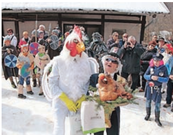
Pečeno svinjsko glavo je odnesla msa Slovenska kokoška.