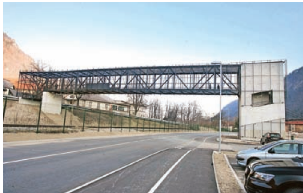
Prečne povezave čez bohinjsko progo v Hrenovco se je prijelo ime Črni most.

jinski upravljavnik, dokaj zapleteno pa je tudi ravnanje s komandno tablo. Obenem se na Občini Jesenice bojijo vandalizma, saj so se v zadnjem letu dni, kar je zgrajena prečna povezava prek Hrenovce, vandali znesli nad obema dvigalom na Rdečem in Črnem mostu, je pojasnila Goriškova. Zato so bili na občini prisiljeni vzpostaviti videonadzor območja. Zaradi vseh omenjenih težav so sklenili, da bodo našli ustreznejšo tehnično rešitev od sedanje dvizne ploščadi, ki bo omogočala tudi bolj funkcionalno uporabo. Tako naj bi še letos zgradili klančino, 11 tisoč evrov v letošnjem proračunu pa je že zagotovljenih. »Projekt klančine je v izdelavi, omogočala pa bo nemoten prehod vsem uporabnikom, tako invalidom, mamamicam z vozički kot tudi drugim, ki bodo raje uporabili klančino namesto stopnic,« je še pojasnila Goriškova.