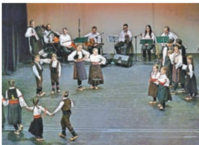
Predstavile so se vse folklorne skupine in obe pevski skupini.