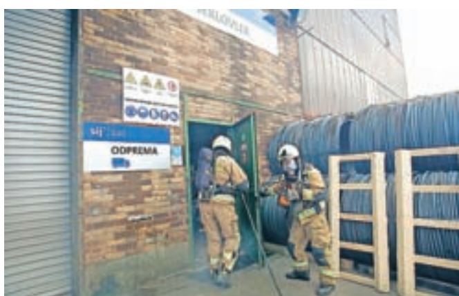
Poklicni gasilci GARS Jesenice so izvedli vajo reševanja iz obrata Jeklovlek v primeru požara.