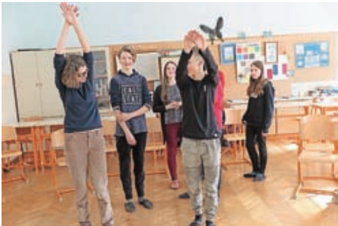
... predvsem pa zabavna.