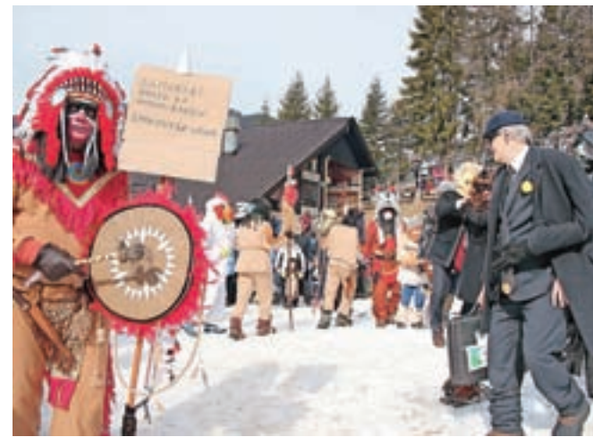
Šamanski obred za Španov vrh je zmagal v kategoriji skupinskih mask.