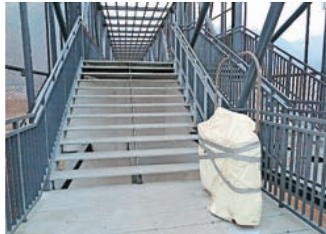
Dvizna ploščad za invalide je nefunkcionalna, zato bodo še letos zgradili klančino.