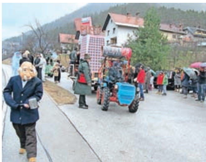
Na tradicionalni pustni povorki na Hrušici: Vodkavod in druge maske