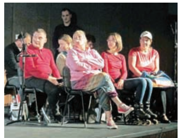
Učitelji glasbene šole so mladim obiskovalcem na zabaven način prikazali, kako se na koncertu ne smemo obnašati.

motili nastopajoče. Obenem pa so ob vsaki točki mladim poslušalcem položili na srce, kako se je na koncertu treba obnašati. "Na koncert je priporočljivo priti pet minut prej, se tiho in udobno namestiti in izklopiti mobilni telefon. Če začetek zamudimo, se premikamo do stola samo med ploskanjem. Obleka naj ne bo neprimerna: kratke hlače, trenirke ne sodijo na koncert. Tudi nastopajoči so poskrbeli, da imajo na sebi »nobl« obleko, v kateri se počutijo lepo in udobno. Nastopajočega po uvodnem priklonu pozdravimo s ploskanjem. Nastop pazljivo in zbrano poslušamo, ne šumimo s papirjem, ne klepetamo. Majhni otroci, ki se naveličajo poslušanja, motijo nastopajoče in ostale poslušalce, prav tako je moteče preglasno kašljanje. Pozorni smo na program, ki ga bomo slišali, saj na programskem listu lahko razberemo, kdaj smemo ploskati (med večstavnim delom NE!). Če je pri izvedbi prisoten dirigent, je stvar preprosta: ploskamo šele, ko dirigent spusti roki.