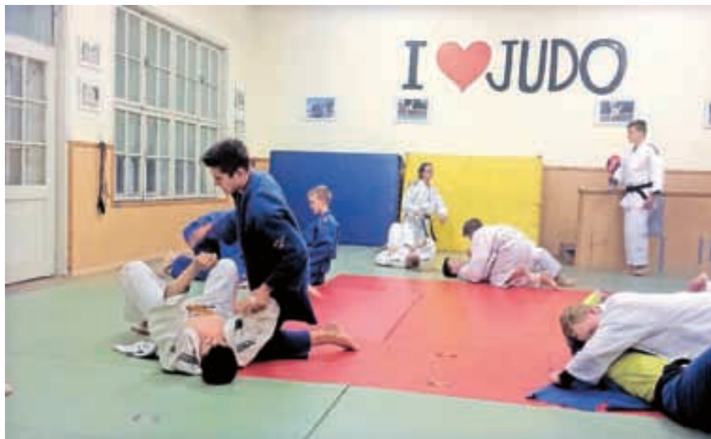
V TVD Partizan si želijo izboljšanja pogojev za vrhunske športnike – judoiste, akrobate in druge, ki trenirajo v okviru enega najstarejših društev.