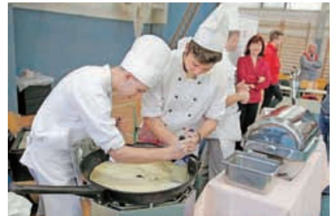
S stojnice Srednje gostinske in turistične šole Radovljica je dišalo po cesarskem pražencu.