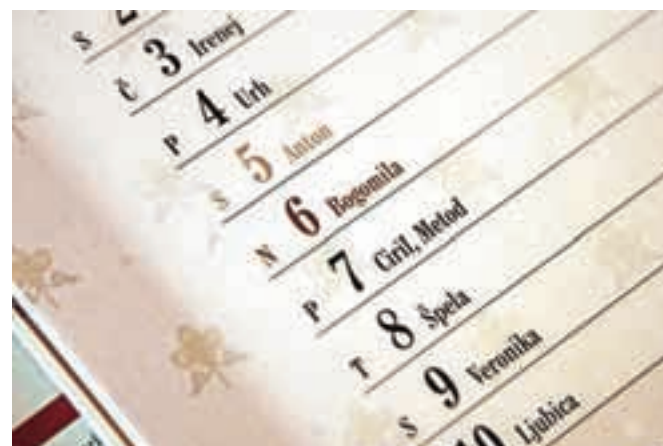
V krščanskem koledarju ima vsak dan v letu svojega svetnika in včasih so otroke poimenovali po tistem, na katerega god so bili rojeni.