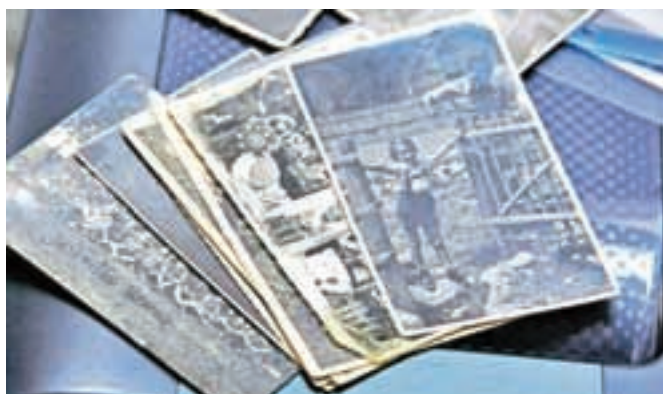
Največ spominov na praznovanja je ohranjenih na fotografijah z motivi družinskih in cerkvenih praznovanj, porok ...