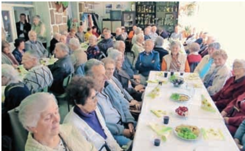
Srečanja se je udeležilo kar 76 članic in članov.