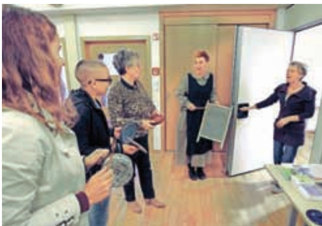
Godovniku so po starem običaju prišli ofirat s pomočjo "piskrov", pokrovk, kuhalnic, ribežnov ...