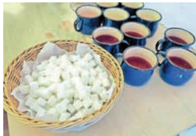
Malinovec in sladkorne kocke – kot v starih časih, manjkali so edino "fancovti" ...