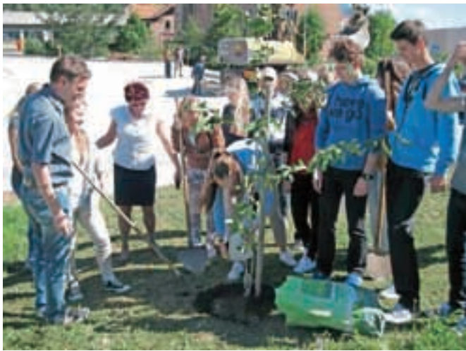
Dijaki Gimnazije Jesenice so na Stari Savi posadili dve drevesi.