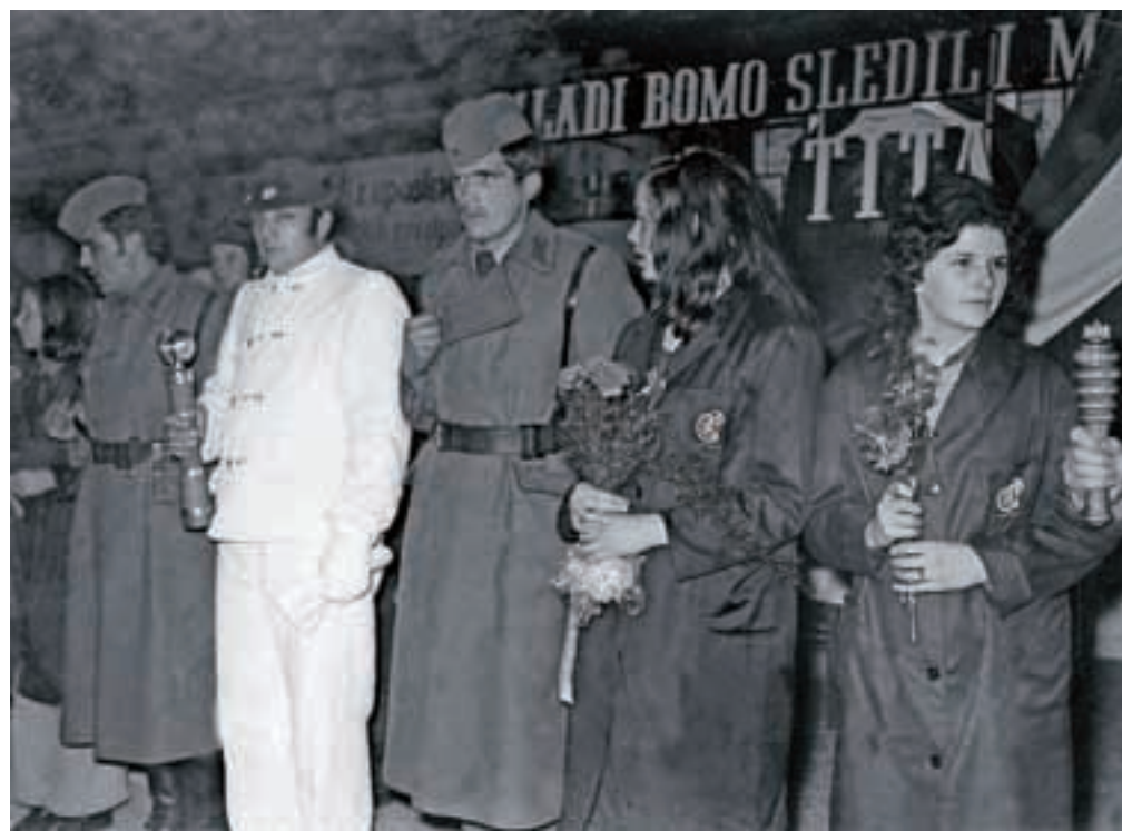
Sprejem štafetnih palic v martinarni aprila 1975

in mrazu. KID je po dveh tednih prekinitve dela zopet pognala obrate. Delavcem je znižala plače in pripravila novo kolektivno pogodbo. Prišlo je do dolgotrajnih pogajanj med vodstvom podjetja in delavskimi zaupniki. Ker so bila neuspešna, je Jesenice zajel stavkovni val, ki je vrhunec dosegel julija 1935. Stavka se je 12. julija najprej začela v javorniških obratih in se razširila na Jesenice. Delavci niso zapustili tovarne, hrano so jim trikrat na dan nosili svojci. Delavke in žene delavcev so zastražile vhode v obrate in z živim zidom orožnikom preprečile, da bi prišli v tovarno in razgnali stavkajoče. Po osmih dneh je prišlo do sporazuma z vodstvom tovarne. Stavko so organizirali in vodili delavski zaupniki, ki so jih delavci izbirali na posebnih volitvah. Ohranjen je volilni imenik enega izmed volišč, in sicer v opekarni iz leta 1937. Tukaj je od 1641 volivcev svoje glasove oddalo tudi 82 žensk. Podatek je pomemben, ker ženske še niso imele splošne volilne pravice. Dobile so jo šele po drugi svetovni vojni. Takrat je bilo aktualno prikazovanje žensk v boju za svobodo, na volitvah, proslavah, v tovarnah, delavnih akcijah, v tekmovanju za presežanje delovnih norm ter prikazovanje njihovega navdušenja nad oblastjo, ki je premagalo fašizem in jim prineslo volil-