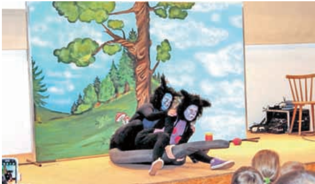
Vrhunec prireditve je bila predstava Kosovirji na letеči žlici.