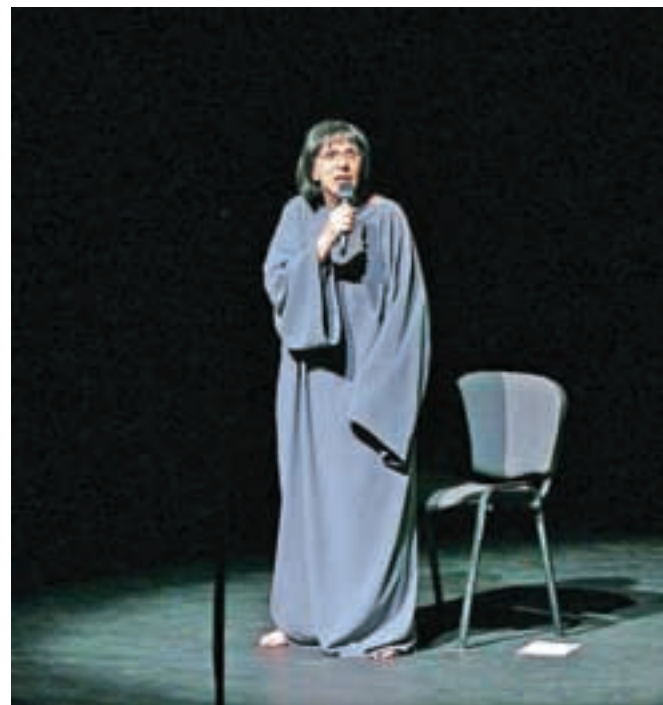
Prva dama slovenske poezije Svetlana Makarovič je ob glasbeni spremljavi Zlatka Kaučiča interpretirala svoje najbolj grozljive pesmi v literarno-glasbenem projektu Horror mundi/Groza sveta.