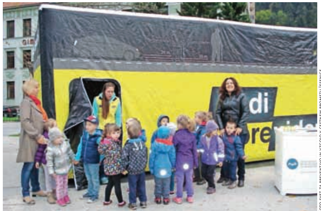
Akcija je bila v prvi vrsti namenjena najranjlivejšim udeležencem v prometu, torej predšolskim in šolskim otrokom pa tudi starejšim občanom.

Šestega oktobra je bil trg Toneta Čufarja na Jesenicah poln preventivnih aktivnosti v sklopu akcije Bodi PreViden, ki jo je organiziral svet za preventivo in vzgojo v cestnem prometu skupaj z Policijsko postajo Jesenice, Medobčinskim inšpektoratom in redarstvom občin Jesenice, Gorje, Kranjska Gora in Žirovnica. Kot so povedali organizatorji, se je akcije udeležilo okoli 500 udeležencev, na kar so ponosni. Akcija je bila v prvi vrsti namenjena najranjlivejšim udeležencem v prometu, torej predšolskim in šolskim otrokom pa tudi starejšim občanom. AMZS je na poligonu s pomočjo štirikolesnikov uprizoril promet v malem, predstavljen je bil prevračalnik, s katerim so obiskovalci spoznali in preizkusili, kako pravilno ravnati ob morebitni situaciji prevrnjenega avtomobila v prometni nesreči. Na trgu je bila postavljena tudi demonstra-