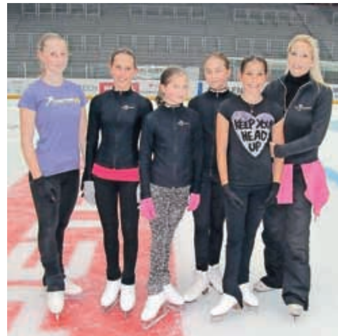
Utrinek s treninga umetnostnih drsalk na ledu Športne dvorane Podmežakla

Znanje umetnostnega drsanja si pod vodstvom Anje in Kaje Otovič nabira okoli petnajst deklet in en fant.