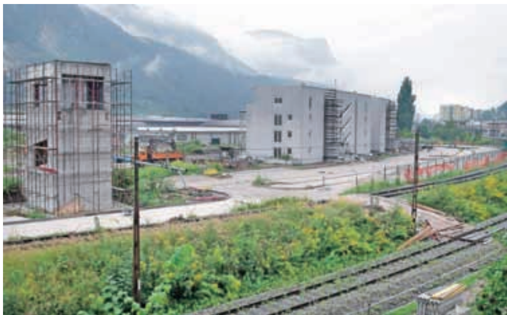
Stanovanja v štirih večstanovanjskih blokih bodo začeli prodajati oktobra. Postavili bodo tudi nadhod čez bohinjko progo, steber na severni strani proge že stoji. Povezovalni most bo dolg 62 metrov.

Kot je znano, je štiri večstanovanjske objekte v Hrenovci začel leta 2007 graditi Gradis GP Celje, ki pa je kasneje šel v stečaj. Projekt je prevzel Aleasing, ki je nedokončane bloke lani prenesel na Anepremičnine, to je nepremičninsko družbo v lasti Abanke. Letos pomladi so v Hrenovci znova zabrnili gradbeni stroji, v Anepremičninah pa so se