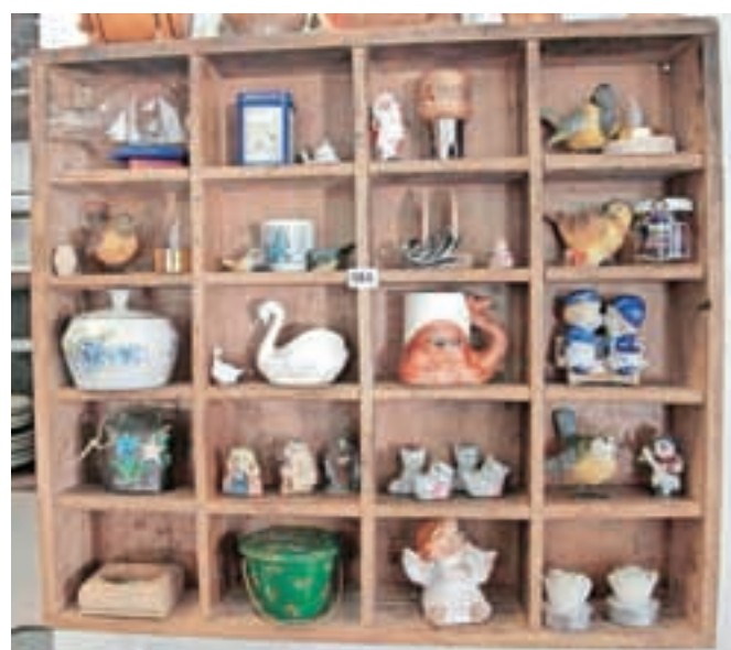
Cene so simbolične in se gibljejo od pol evra do deset evrov.