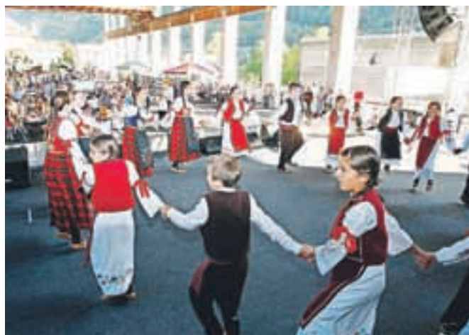
Poleg koncertov je v navijaški coni nastopala tudi folklor različnih narodnosti.