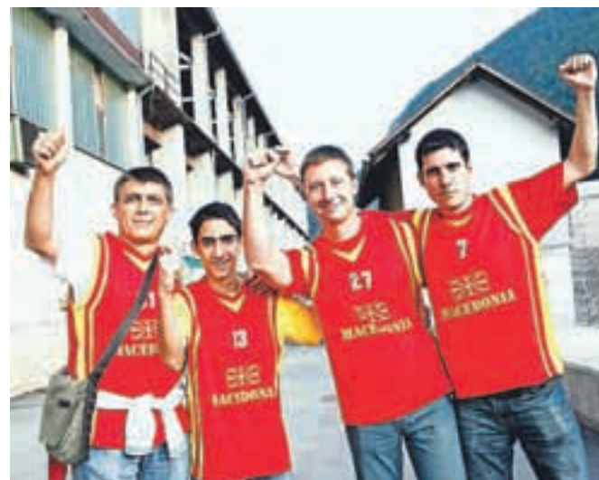
Najbolj številni so bili navijači Makedonije.