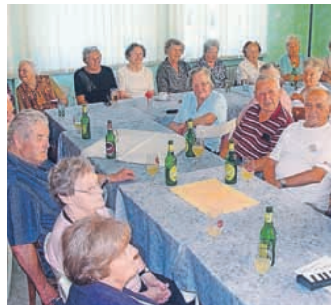
V sklopu praznovanja krajevnega praznika vsako leto pripravijo tudi srečanje s starejšimi krajanji.