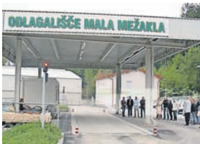
Nov vstopni plato s tehtnico, v ozadju desno nova upravna stavba, ki jo bo ogreval deponijski plin, levo pa sortirnica.

bi (sicer z veliko zamudo) začela delovati tudi sortirnica, objekt je koncesionar že zgradil, tehnologija pa je naročena, je dejal Markelj. Župani so ob tem izrazili zadovoljstvo, da je deponija Mala Mežakla urejena v skladu z vsemi zahtevami, kar je še posebej pomembno v teh časih, ko so redke občine, ki se lahko pohvalijo z lastnim deponijskim prostorom.