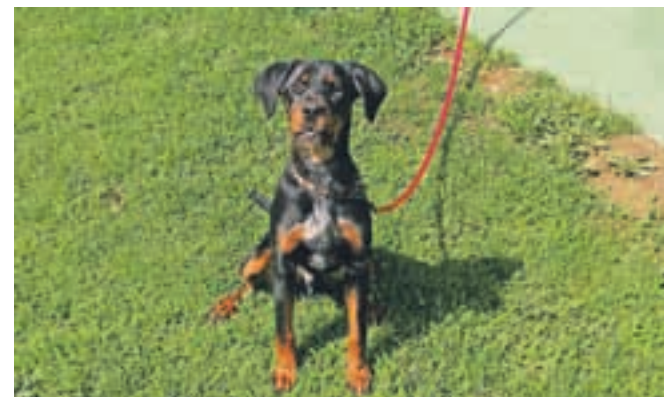
Dom išče mešanček, star 6 mesecev. Tel.: 041/666-187