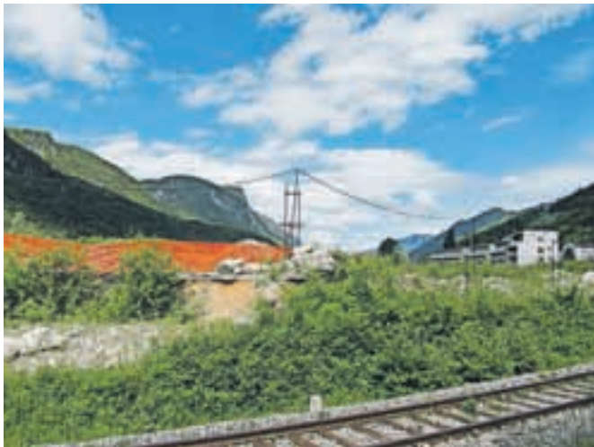
Mercator v Hrenovci očitno ne bo gradil trgovskega centra, saj zemljišče prodaja za 3,4 milijona evrov.

zemljišča, ki ga potrebuje za gradnjo stebra za prečno povezavo, kar je tudi pogoj za pridobitev gradbenega dovoljenja za omenjeno povezavo. Ob tem pa tudi ni znano, kdaj bo Aleasing nadaljeval gradnjo štirih nedokončanih blokov na tem območju. Zadeva je zapletena, je dejal župan, ki pa kljub temu ostaja optimist in upa, da bodo zadeve v Hrenovci pripeljali do uspešnega zaključka.