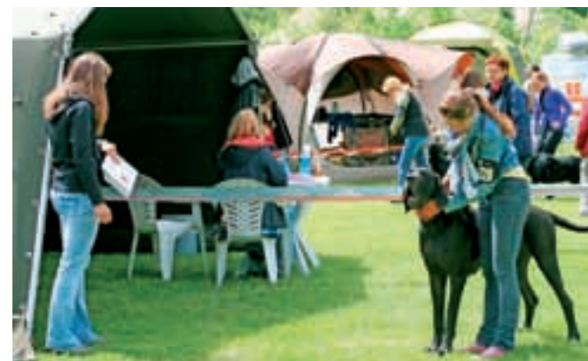
Razstave so se udeležili razstavljalci iz enajstih držav z več kot tristo psi.