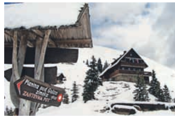
... in nato spet prava zima pri Koči na Golici 26. maja.