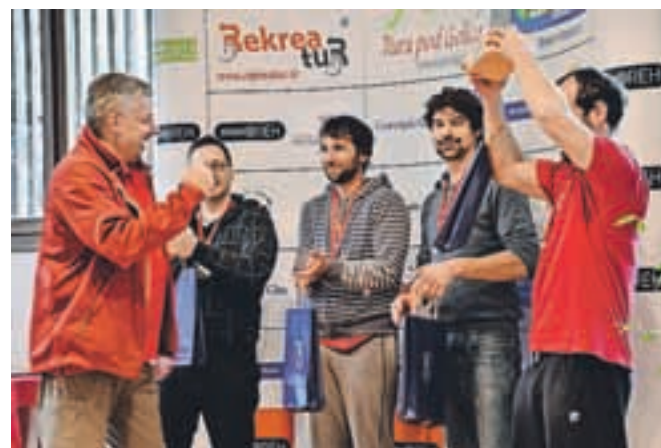
Župan in zmagovalci

Rogarjevega rovtu prihajali postopoma, je bila prikaza in praktičnega dela deležna skoraj polovica. Žal je točno