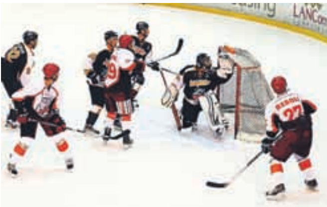
Jesenice bodo še eno leto brez članske ekipe v ligi EBEL.