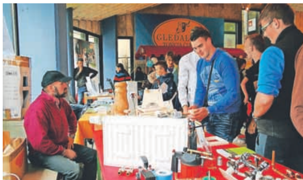
Namen sejma je bil osnovnošolcem v osmih in devetih razredih predstaviti obrtne poklice, saj se za izobraževanje zanje odloča vse manj mladih.

glavni oltar bazilike svetega Petra v Vatikanu. Kot je še dodal Zima, je namen sejma osnovnošolcem v osmih in devetih razredih predstaviti obrtne poklice, pri katerih opazajo zmanjšanje vpisa v šolske programe: "Želeli bi, da bi otroci pred prihodnjim letom, ko bodo soočeni z eno najpomembnejših odločitev za vpis v srednje šole, videli, da obrtni poklici niso noben babbav, temveč gre za delo, ki je aktualno." Na obrtno-podjetniškem združenju so bili z obiskom prvega tovrstnega sejma zadovoljni, zato upajo, da se bodo šolarji v prihodnje bolj odločali za tovrstne poklice.