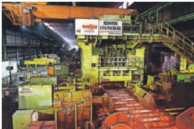
Novo valjavsko ogrodje je "srce" Acronija, omogoča izdelovanje širših in kakovostnejših plošč.