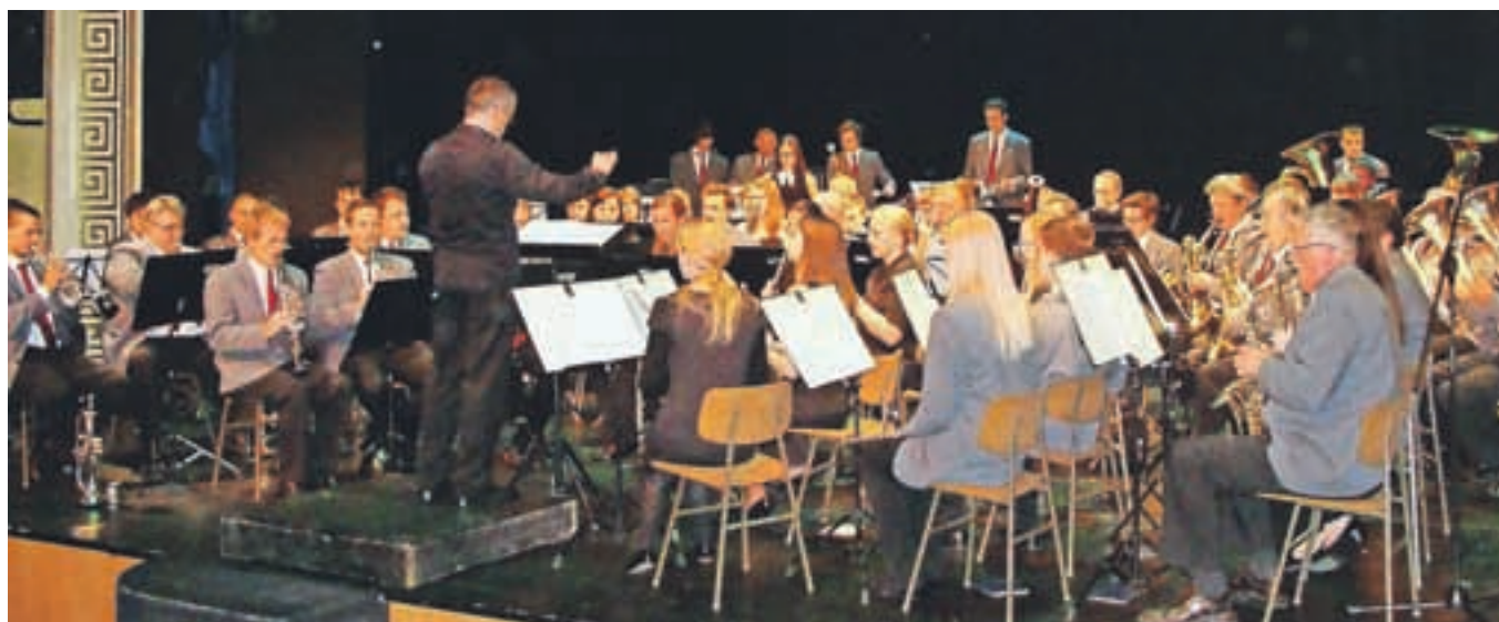
Delavska godba Trbovlje je navdušila na Jesenicah.