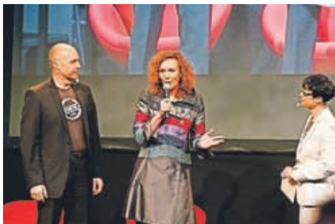
Naprava, katere zagon so pospremili z geslom "jeklena volja", nosi ime po "jekleni" bronasti olimpijki Petri Majdič, ki se je slovesnega odprtja tudi udeležila.