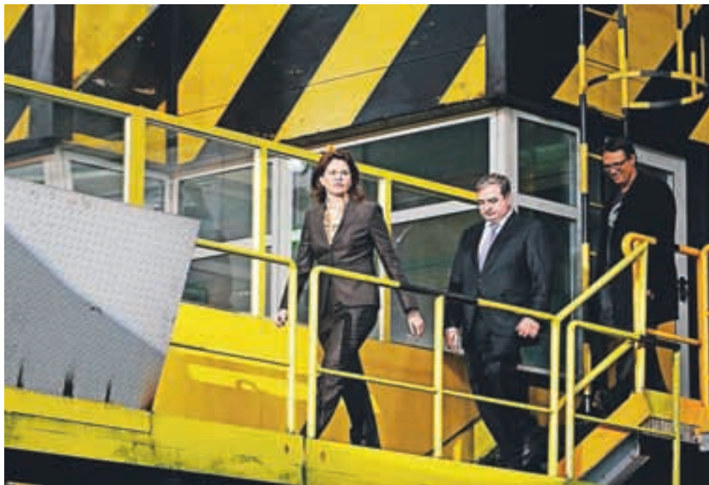
Novo valjavsko ogrodje v Acronijevi vroči valjarni je odprla predsednica vlade Alenka Bratušek.