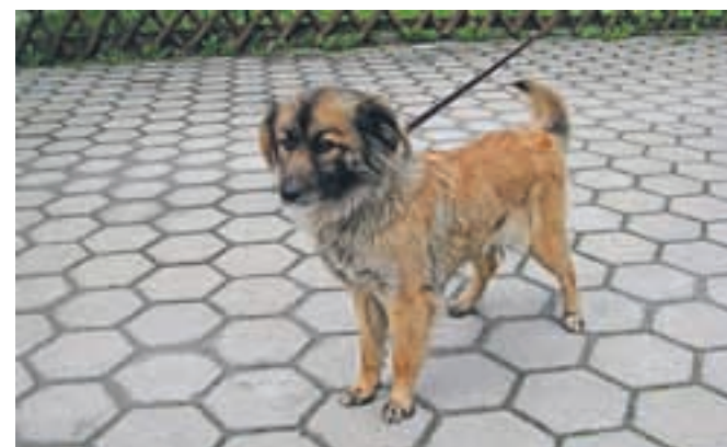
Dom išče 3-mesečna psička mešanica. Tel.: 041/666-187