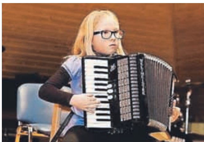
Zala Zarja Mesec