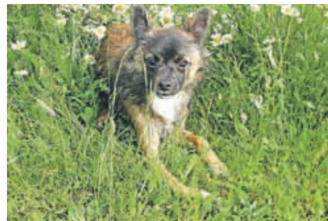
Dom išče mladič mešanec s čivavo. Tel.: 041/666-187