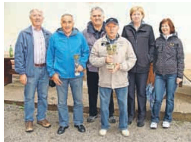
Najboljši upokojenec športniki iz Društva upokojenec Jesenice

Na podlagi točkovanja o udeležbi na vseh tekmovalnih so na letošnjih rekreacijskih športnih igrah prvo mesto in prehodni pokal spet osvojili športniki Društva upokojenec Jesenice, na drugo mesto so se uvrstili športniki Društva upokojenec Javornik-Koroška Bela in na tretje mesto športniki Društva upokojenec Dovje-Mojstrana.