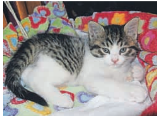
Nov dom išče deset muckov, starih 3 mesece. Tel.: 051/358-234