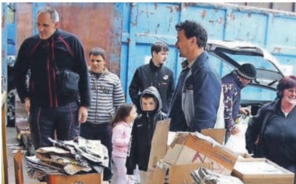
Na šoli vsako šolsko leto pripravijo dve papirni akciji in učenci so močno motivirani, da pripeljejo kar največ starega papirja, nekateri posamezniki tudi več kot tono.