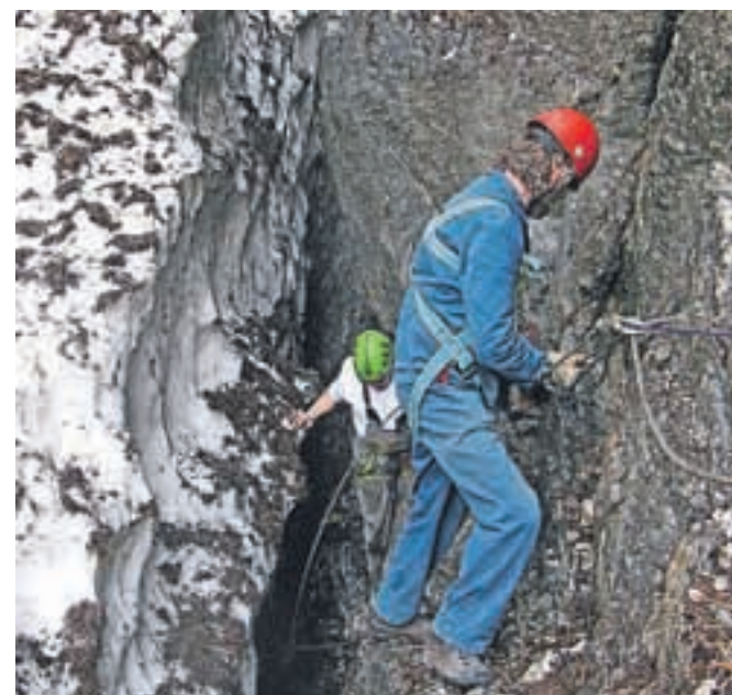
Ker je pri samem izvira še veliko strjene plazovine, je bilo delo še posebej nevarno.