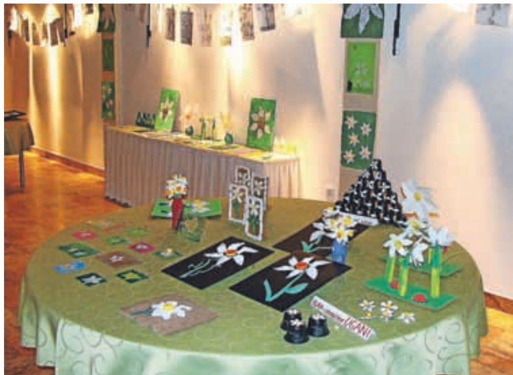
Na ogled so bili različni izdelki, povezani z narcisami oziroma ključavnicami, ki vsako leto poskrbijo za največjo prepoznavnost občine v širšem slovenskem prostoru.

pravili v dvorani Kolpern. Na ogled so bili izdelki otrok jeseniških vrtcev, učencev Osnovne šole Tone Čufarja, varovancev Varstveno delovnega centra Jesenice in udeležencev delavnic v Gornjesavskem muzeju.