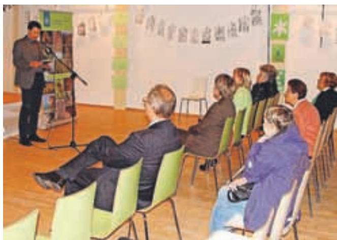
Predstavili so knjigo z naslovom V Rovtih nad Jesenicami – narava in človek ustvarjata biotsko pestrost . Izdal jo je Zavod Republike Slovenije za varstvo narave.

Občina Jesenice je skupaj z Gornjesavskim muzejem Jesenice mesec narcis zaočkrožila z razstavo in prireditvijo v dvorani Kolpern na Stari Savi. Na ogled so bili različni izdelki, povezani z belimi cveticami, ki vsako leto poskrbijo za največjo prepoznavnost občine v širšem slovenskem prostoru. Turistični informacijski center Jesenice je najprej organiziral manjše razstave na temo narcis na različnih lokacijah v mestu in v Planini pod Golico. Skupno razstavo pa so zatem pri-