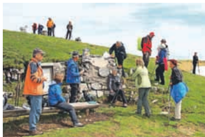
Lepo spomladanski dan na vrhu Golice 12. maja ...

Letošnja pomlad je res nenavadna, kar dokazuje fotografija, ki sta jo 24. maja napravila oskrbnica Doma Pristava Stanka in Drago. Tege dne je namreč na Pristavi – snežilo! Da bi konec maja padal sneg, je res redko. Upajmo, da bo vsaj poletje pravo, če je bila že pomlad – zimska ... U. P.