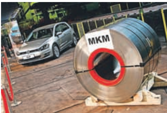
Acroni je čedalje bolj uspešen tudi v avtomobilski industriji, v golfu serije 7 je prvič serijsko vgrajen kovinski katalizator, za katerega folijo izdelujejo prav na Jesenicah.