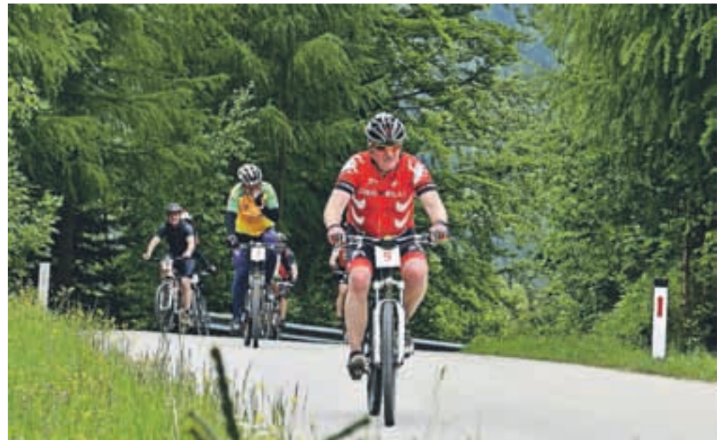
Domačinov je najmanj, verjetno zato, ker vedo, kako težka je trasa.

Ture se je udeležilo 11 ekip z 48 kolesarji. Prihajale so iz vseh delov Slovenije, tudi s Hrvaškega, le domačinov ni bilo. Razlog je verjetno v tem, da vedo, kako zahtevna je trasa. Ne vedo pa, kaj vse jim organizatorji ponujajo. Kolesarji so na trasi doživeli marsikaj. Najprej jim je uspelo zadeti vrhunec cvetenja narcis. Voznik zadnjega vozila se jih je nagledal na polno, saj se je ekipa Promotiv (prva udeleženka iz Hrvaške!) zaustavila skoraj povsod in snemala in snemala ... "Letos so skupaj odkrili nišo, kako kolesarjenje narediti tudi izobraževalno. Na Rogarjevem rovtu, kjer organizatorji tradicionalno poskrbimo za zabavno animacijo (medved, kontrabant), so fantje pripravili tečaj oživljanja nezavestnega človeka, prikazali, kako deluje defibrilator, in praktično pokazali obilo koristnih nasvetov prve pomoči. Ker so kolesarji do