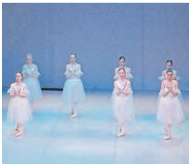
Učenke 6. razreda, ki letos zaključujejo šolanje, v točki Vile

Valant pa je na koncu podelila priznanja sedmim učenkam, ki letos zaključujejo šesti razred, udeleženkam državnega tekmovanja in obema mentoricama. Navdušeni obiskovalci predstave – starši, sorodniki in prijatelji – so povsem napolnili dvorano jeseniškega gledališča.