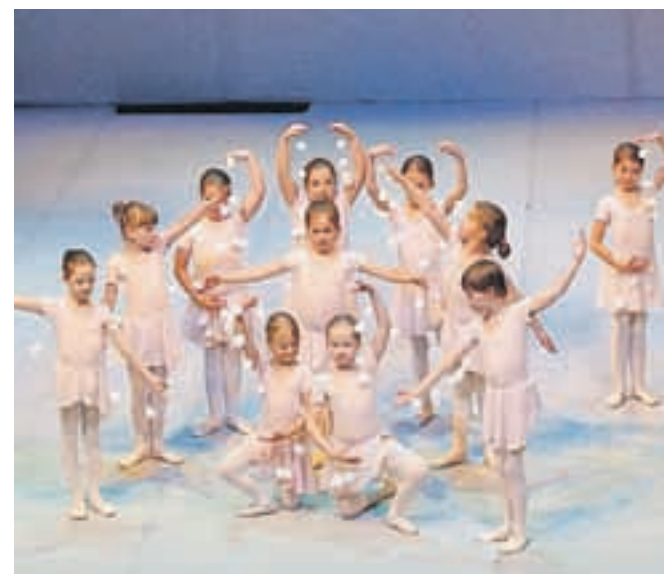
Najmlajše učenke plesne pripravnice v točki Snežinke