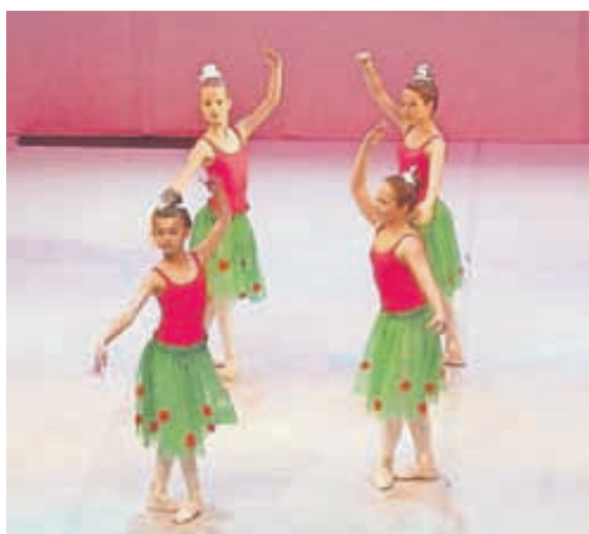
Ples ur v izvedbi učenk 3. razreda