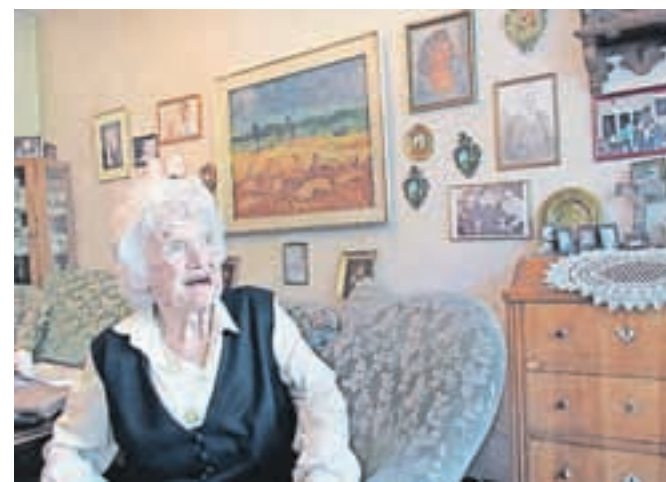
Na mladost jo spominjajo številne fotografije in slike na steni dnevne sobe.