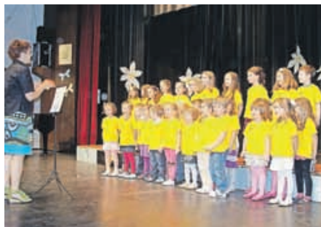
Otroški pevski zbor Mehurčki Vrtca Jesenice