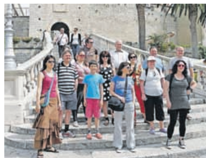
Ekipe Lutkovnega gledališča Ringo raja na Korčuli