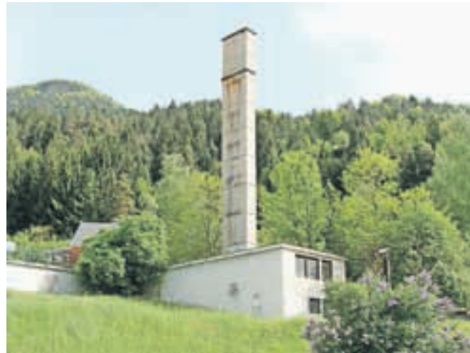
Kotlovnica na Belem polju, ki jo bodo temeljito prenovili.

V krajevni skupnosti Hrušica se po večletnih prizadevanjih vendarle obetajo dobre rešitve za ogrevanje večine večstanovanjskih stavb. Predvsem bodo ugodne za lastnike stanovanj, energetsko učinkovite, ogrevanje pa bo bolj prijazno do okolja. V naselju Belo polje, kjer je na staro in dotrajano kotlovnico priključenih 108 stanovanjskih enot v enajstih večstanovanjskih stavbah, je Dominvest Jesenice kot večinski upravnik kar nekaj let z lastniki iskal možnosti za sanacijo. Predstavljal je različne ponudbe, vendar po vrsti niso bile sprejemljive za večino. Sedaj je, kot kaže, vendarle na obzorju najboljša, ki praktično brez finančne bremena lastnikov stanovanj prinaša še prihranke pri ceni ogrevanja. Dominvest je na sestanku konec marca vsem lastnikom predstavil princip energetskega