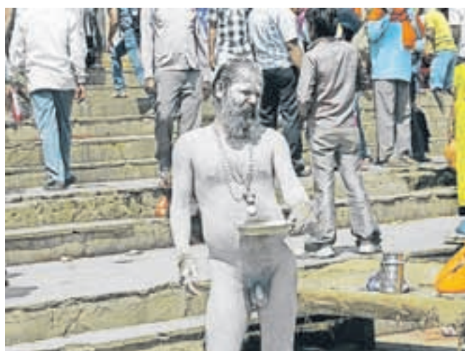
Indijski sveti mož