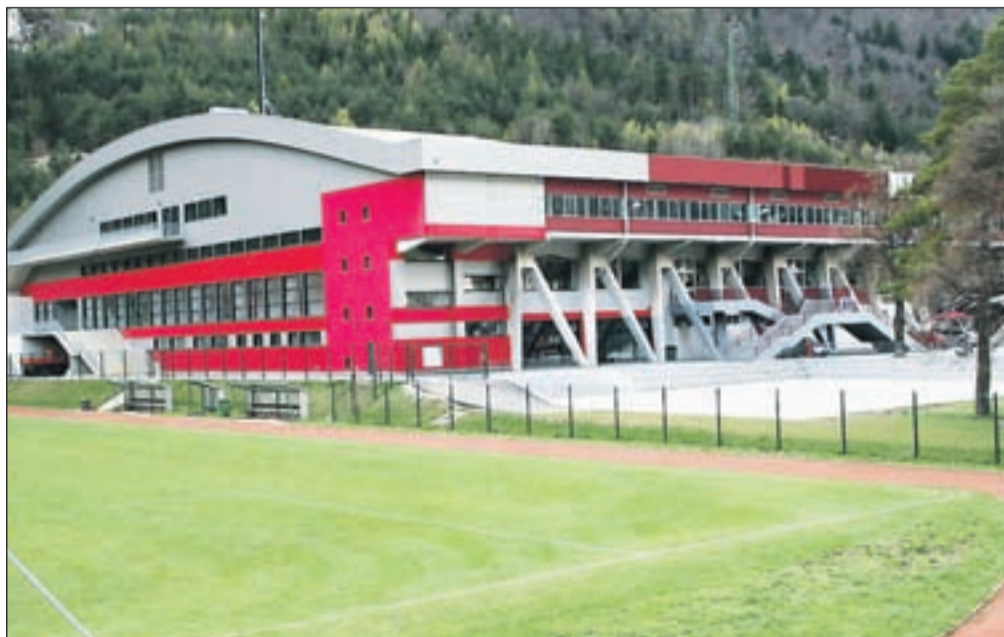
Športna hala Podmežakla mora biti prenovljena do konca marca prihodnje leto.