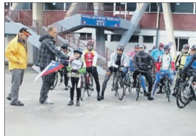
Juretov sin Nal je dal znak za start sedemdesetim udeležencem.