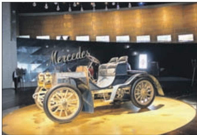
Od 1902 se je ime Mercedes za avto - po Daimerjevi hčerki Mercedes - ohranilo vse do danes.

Zgodaj zjutraj smo šli najprej v Derendingen, kjer je Trubar med letoma 1567 in 1586 vodil župnijo in je tu tudi pokopan. Ta cerkva je pravi Trubarjev muzej. Domačini so prav tako ponosni nanj kot mi, Slovenci. Nato smo se odpravili v stari del slikovitega mesta Tübingen, kjer je naš veliki literat leta 1550 natisnil prvi slovenski knjigi Katekizem in Abecednik. Sledil je ogled znanega letoviškega mesta Bad Urach, kjer je Trubar po svojem umiku iz Kranjske vodil Slovanski biblijski zavod. Nato je sledil še postanek v Augsburgu, ki je bil v srednjem veku eno glavnih političnih in finančnih središč v Evropi. Tu je bila leta 1555 potrjena enakopravnost katoliške in protestantske vere. Ogledali smo si tudi kompleks Fuggerei, kjer so si in si še danes starejši in socialno ogroženi ljudje lahko najamejo stanovanje za 88 centov. To je najemnina za celo leto. Domov smo se vrnili utrujeni, vendar bogati za nova spoznanja.