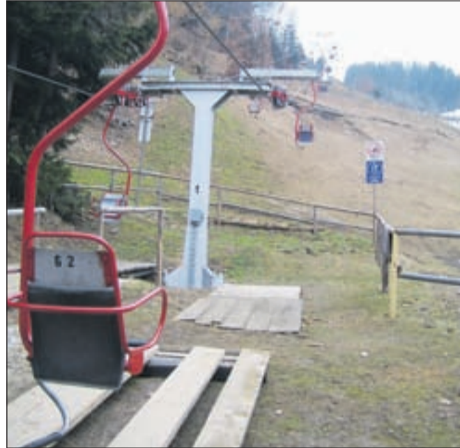
Sedežnica Španov vrh je bila zgrajena daljnega leta 1964 in je druga najstarejša še delujoča smučarska naprava v državi, leto starejša je le še nihalka na Veliko planino.

Na slovenskih smučiščih bodo v novi smučarski sezoni veljala strožja pravila glede obratovanja žičniških naprav, zlasti natančno bodo inšpektorji pregledovali naprave, ki so starejše kot trideset let. Po novem pravilniku o tehničnih pregledih žičniških naprav morajo do konca novembra letos opraviti prve posebne preglede žičnic, zgrajenih pred letom 1976, in vlečnic, zgrajenih pred letom 1971. Taki pregledi so zahtevani tudi v evropskih standardih, njihov namen pa je zlasti pregled nosilnih elementov, ki so bistveni za varno obratovanje. Ob tem so nekateri žičničarji izrazili skrb, da bo to ogrozilo obstoj zlasti manjših smučišč, ki si s prihodki od že tako slabih smučarskih sezon ne bodo mogla privoščiti dragih pregledov. Kaj to pomeni za edino jeseniško smučišče Španov vrh, katerega sedežnica je bila zgrajena daljnega leta 1964 in je druga najstarejša še delujoča smučar-