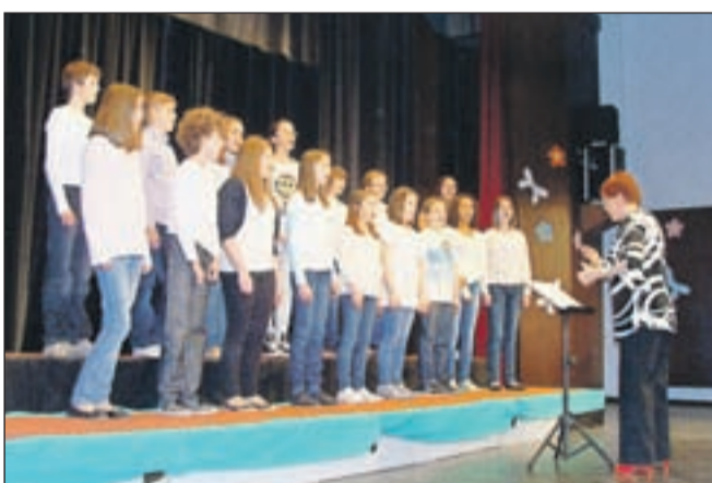
Mladinski pevski zbor OŠ Prežihov Voranc

Kar 250 mladih pevcev, osem zborov od Kranjske Gore do Žirovnice in pester spored prijetnih pesmi. To so glavni poudarki z Območne revije otroških in mladinskih pevskih zborov, ki je bila 12. aprila v dvorani Kulturnega doma na Slovenskem Javorniku. Pevski zbori so znova pokazali, da na osnovnih šolah v vseh treh občinah in na jeseniški Gimnaziji znajo mladim vliti veselje do prepevanja, ki jih potem lahko spremlja vse življenje. To je v veliki meri zasluga učiteljev, mentorjev in zborovodij, ki v to delo vlagajo veliko časa in truda. Na območni reviji je bila strokovna spremljevalka Andreja Martinjak, ki bo pripravila ocene za napredovanje zborov za regijsko srečanje. Za izvedbo je poskrbela Območna izpostava Javnega sklada Republike Slovenije za kulturne dejavnosti Jesenice ob podpori Občin Jesenice, Kranjska Gora in Žirovnica. J.R.