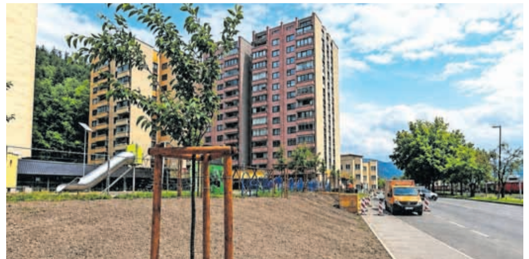
Pred kratkim so že poskrbeli za zasaditev novih dreves, ob igrišču zdaj rastejo javorji, ob dostopni poti do igrišča pa dve okrasni češnji.

»Sledilni preizkus z injiciranjem na območju Roblekovega doma ni dal zanesljivih rezultatov, vendar so podatki o razredčenju in dinamiki pretakanja podzemne vode pomembno prispevali k razumevanju hidrogeološkega sistema. Izkazalo se je, da se v vodonosniku pretakajo izdatne količine podzemne vode, kar povzroča močno razredčenje in otežuje zaznavo sledil,« so zapisali. Glede na ugotovitve je Geološki zavod podal predlog možnih ukrepov. Za učinkovito varovanje vodnih virov je ključno, da se čim prej pridobi celovit pregled nad vsemi izpusti komunalnih odpadnih voda in zagotovi uskladitev z veljavnimi standardi. S to proble-