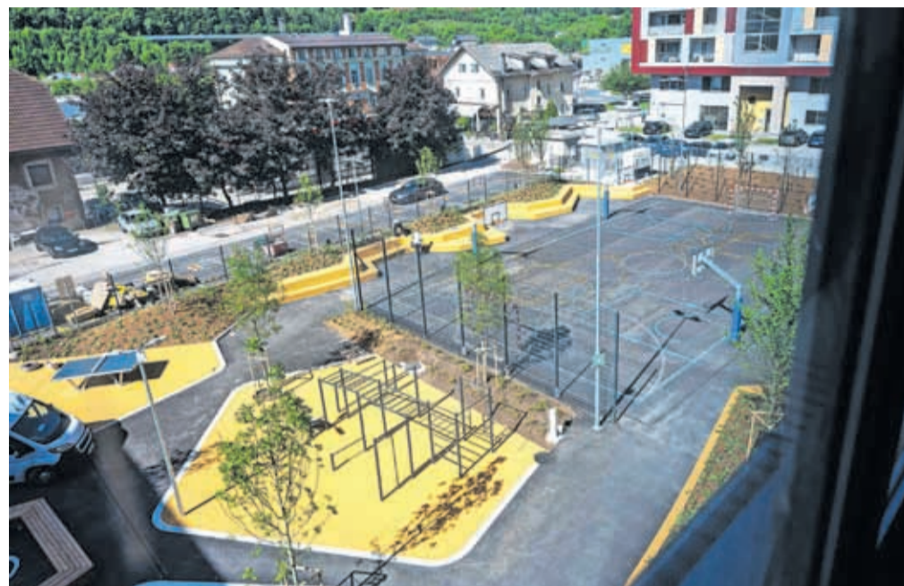
Zunanja ureditev s športnimi igrišči

Projekt je vreden trideset milijonov evrov in je sofinanciran iz Načrta za okrevanje in odpornost v višini 8,8 milijona evrov, preostala sredstva pa je zagotovila država iz proračuna, šola je bila namreč uspešna pri kandidaturi za nepovratna sredstva za izvedbo projekta Prenova in dozidava Srednje šole Jesenice na razpi-