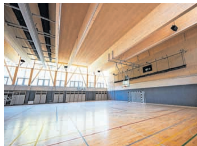
Sodobna telovadnica

zdravstvena nega. Tudi z vpisom v programa strojni tehniki in mehatroniki so zadovoljni, bi pa lahko sprejeli še kakšnega dijaka več.