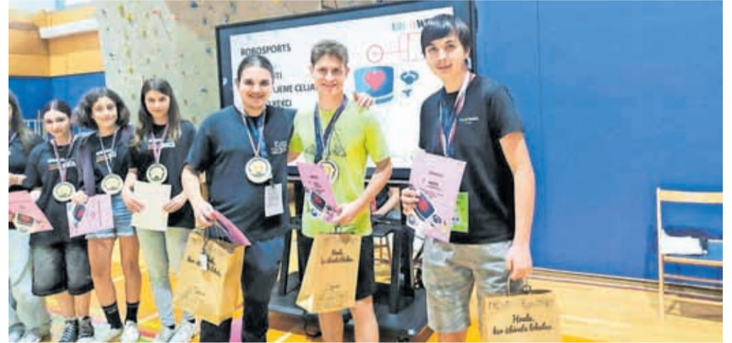
Ekipo Mamuti je osvojila naslov državnih prvakov v robotiki v kategoriji RoboSports.

World Robot Olympiad velja za eno najzahtevnejših tekmovanj na področju izobraževalne robotike. Tekmovalci morajo sestaviti in programirati avtonomne robote, ki nato v realnem času opravljajo