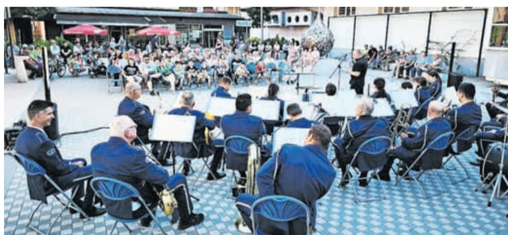
Koncert na Trgu prijateljstva

Po nastopih je sledilo vedno prijetno druženje nastopajočih in obiskovalcev ob stojnicah, kjer so člani posameznih društev predstavili svoje noše in značilne predmete ter postregli s tradicionalnimi jedmi narodov in narodnosti. Za priprave in uspešno izvedbo Kulturne mavrice 2026 so poskrbeli Občina Jesenice, Mladinski center Jesenice in Zveza kulturnih društev Jesenice.