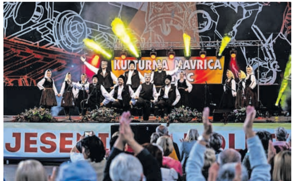
Kulturna mavrica Jesenic