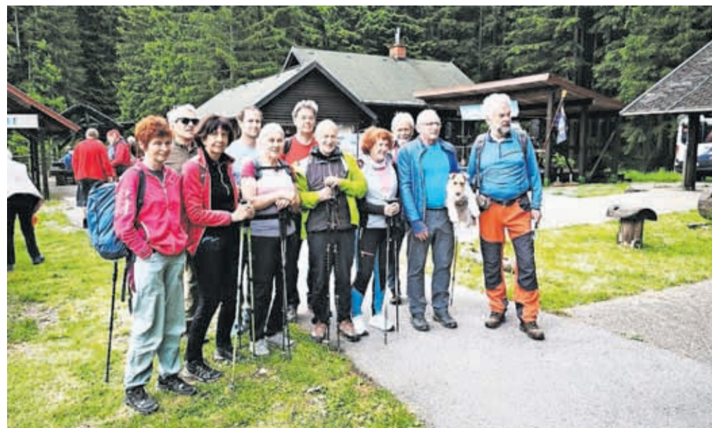
Jeseniški planinci na srečanju

srečanja na različnih lokacijah, za zamejske planince predvsem pomenijo tesnejši stik z domovino. Organizatorji letošnjega srečanja so bili prvič člani planinske skupine Kulturno-prosvetnega društva Bazovica na Reki