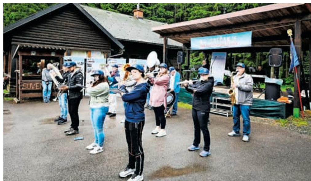
Jeseniška godba na pihala

na Hrvaškem. Na Golubinjaku v Gorskem kotarju so za več kot dvesto udeležencev pripravili pester program pohodov in ogled jame Lokvarika. V imenu gorenjskih planincev sta na srečanju zbrane pozdravila predse-