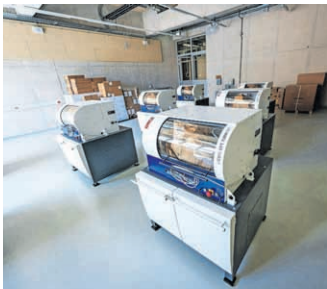
Najsodobnejše računalniško podprte stružnice, na katerih bodo praktične izkušnje pridobivali dijaki strojništva.