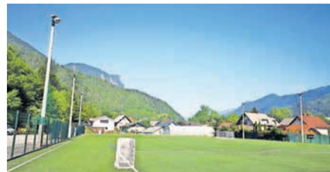
Investicija je obsegala zamenjavo vseh 24 dotrajanih svetil z novo LED-razsvetljavo, ki zagotavlja boljšo osvetljenost igrišča in učinkovitejšo rabo energije.

Občina Jesenice je skupaj z Zavodom za šport Jesenice zaključila energetske in tehnološke posodobitve pomožnega nogometnega igrišča v Športnem parku Podmežakla. Investicija je obsegala zamenjavo vseh 24 dotrajanih svetil z novo LED-razsvetljavo, ki zagotavlja boljšo osvetljenost igrišča in učinkovitejšo rabo energije. Skupna vrednost investicije je znašala približno 23.600 evrov, od tega je Občina Jesenice prispevala 18.600 evrov, Zavod za šport Jesenice pa je pridobil 5.000 evrov na razpisu za sofinanciranje infrastrukturnih projektov v nogometu za leto 2025, ki ga je objavila Nogometna zveza Slovenije. Nova razsvetljava bo prispevala h kakovostnejšim pogojem za treninge in razvoj vseh selekcij NK Jesenice, obenem bodo nižji tudi stroški porabe električne energije, so poudarili na Občini Jesenice. U. P.