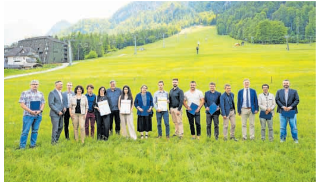
Inovatorji nagrajenih rešitev podjetja SIJ Acroni na podelitvi v Kranjski Gori