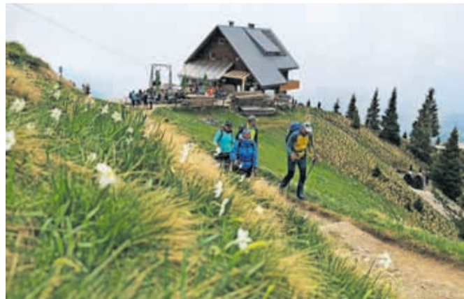
Številni planinci so se povzpeli na Golico.

V treh koncih tedna so ocenili, da je bilo več kot sedem tisoč obiskovalcev, veliko jih je bilo ob lepem vremenu tudi med tednom, predvsem skupin planincev. Letos izvajalci prometnega režima doslej od domačinov niso dobili nobene pripombe ali kritike. Z avtobusom so tudi omogočili obisk vsem, ki so se na Jesenice pripeljali od drugod z vlakom ali rednimi avtobusi.