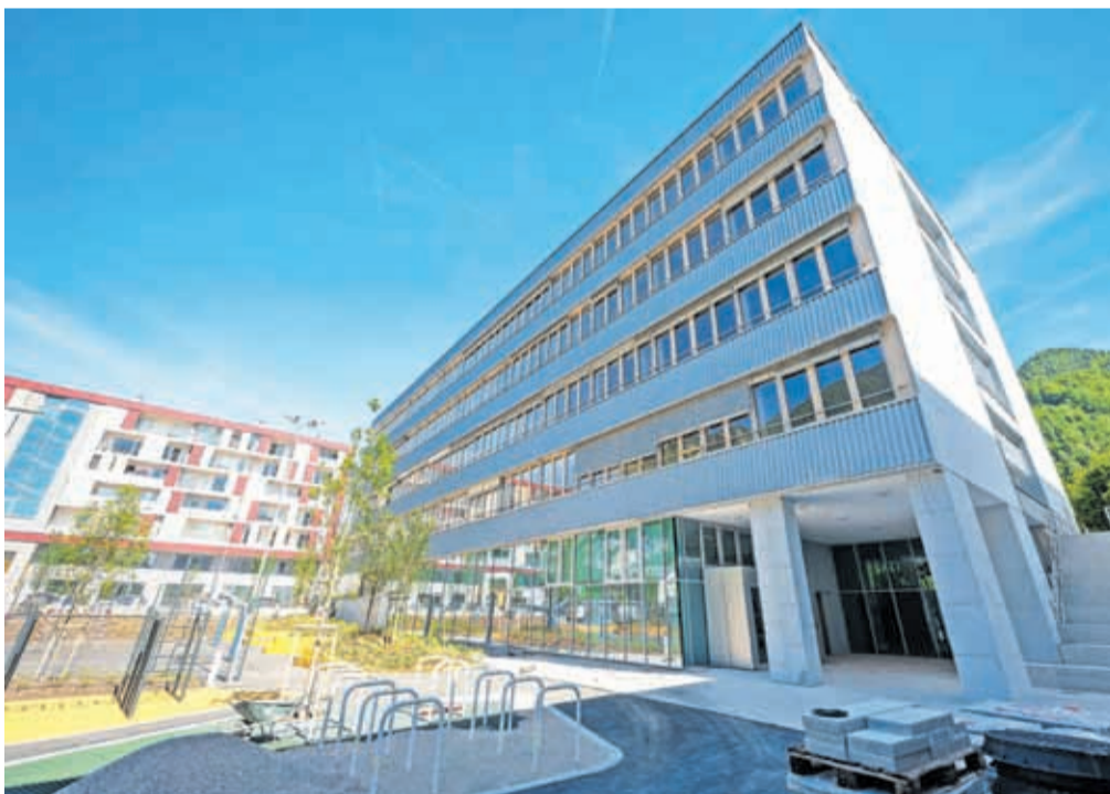
Potem ko so maja lani porušili staro šolo, so novo zgradili v rekordnem času, zgolj desetih mesecih.

Od maja lani, ko so staro šolo do tal porušili, je izbrani izvajalec, podjetje VG5, moral hiteti, saj so bili roki zelo kratki. Dela so zaključili v rekordnih desetih mese-