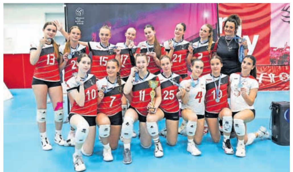
Največji uspeh sezone predstavlja naslov državnih podprvakinj Slovenije, ki so ga osvojile starejše deklice.

Kot poudarjajo v klubu, so dosežki rezultat skupnega