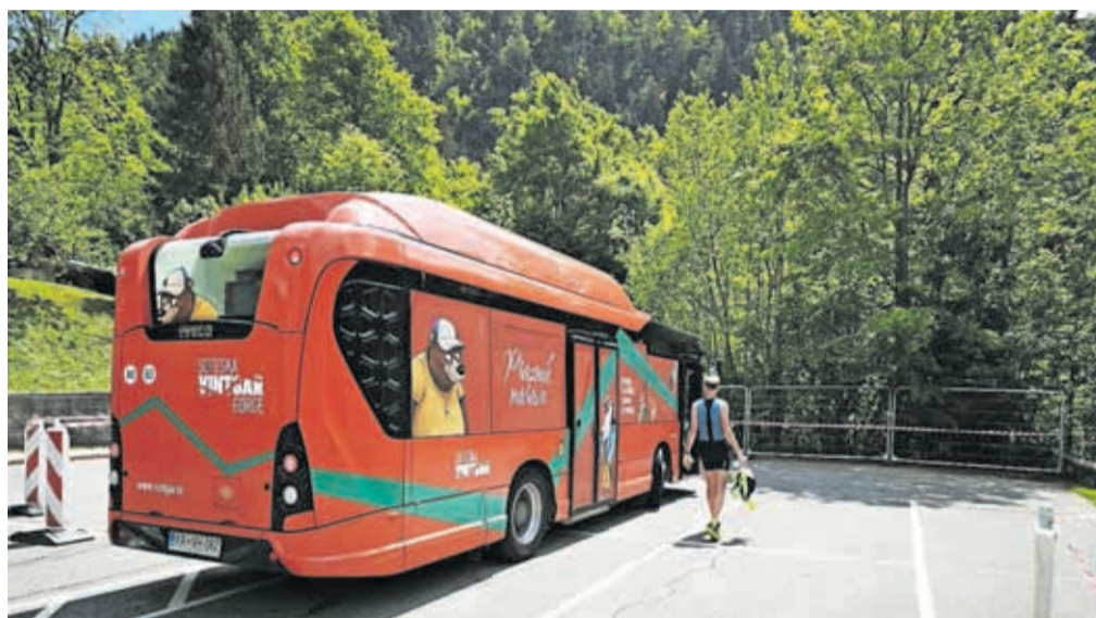
Pomembna novost je bila vožnja z električnim avtobusom Turističnega društva Gorje z Bleda do Planine pod Golico, s katerim so povezali dve turistični znamenitosti, sotesko Vintgar in narcise.

Celoten projekt je naravnani v pravo smer večjega zavarovanja naravnega okolja, predvsem z omejitvijo dostopa vozil, ko so parkirišča zasedena.