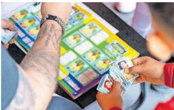
Za tokratni album je treba zbrati 980 sličic, v eni vrečki pa jih je sedem.

Da zbirateljska vročica ni zajela le najmlajših, je potrdil tudi zgovorni potetovirani ljubitelj nogometa, ki sličice zbira skupaj s sinovoma. »To je noro! Na Jesenicah so vse sličice razprodane. Zadnjič