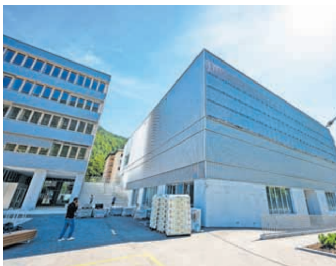
Delavnice in telovadnica so v ločenem objektu.