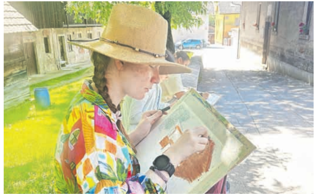
Ob prijetnem sončnem vremenu in v senci dreves so učenci risali, slikali in se družili med seboj.