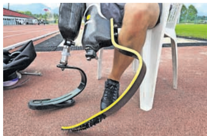
V osrednjem prostoru proteze za sprint, ob njej za daljše razdalje