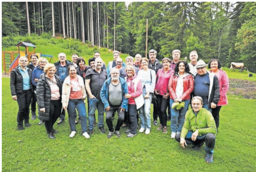
Udeleženci srečanja