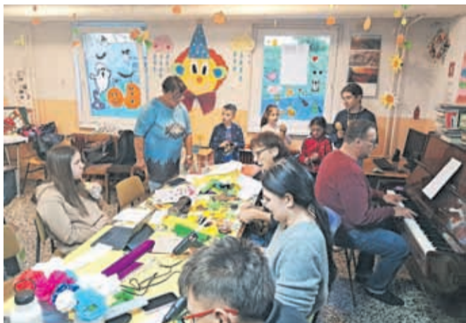
Otroci in mladostniki v Dnevnom centru najdejo prostor za druženje, ustvarjanje, pogovor in sprostitev.