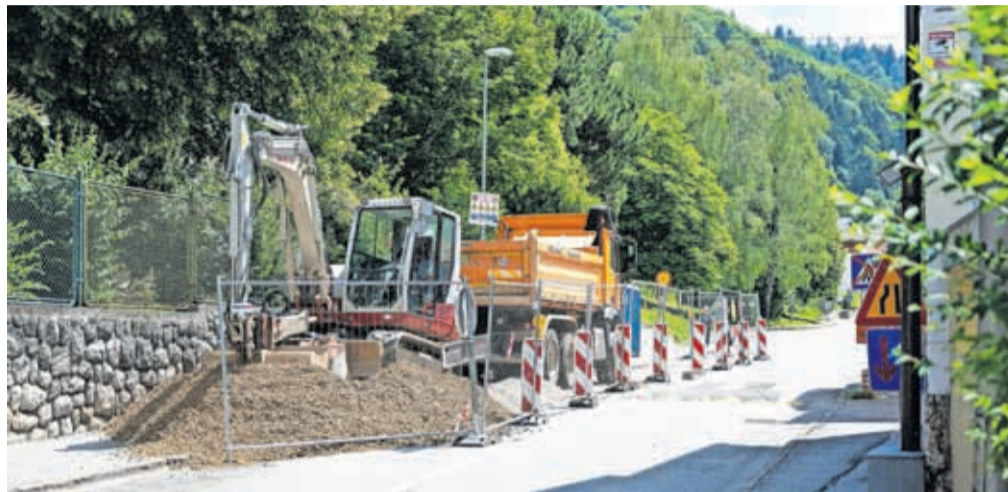
Začenja se obnova ceste od gimnazije do križišča z Ukovo.

Na odseku od Gimnazije Jesenice do križišča z Ukovo bodo obnovili meteorno kanalizacijo, fekalno kanalizacijo in vodovod, preplastili vozišče, obnovili pločnike, javno razsvetljava, uredili priključke na stranske ceste in poti ter obnovili prometno signalizacijo in drugo prometno opremo. Poleg tega bodo uredili dostopno pot do vrta Julke Pibernik skupaj z obnovo me-