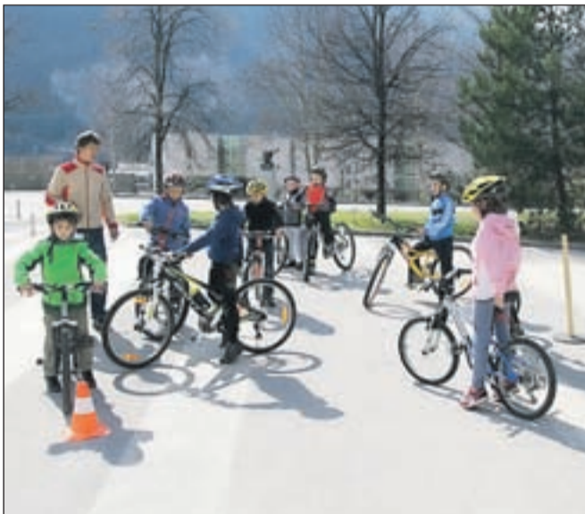
Otroci so se lahko preskusili v spretnostni vožnji na kolesarskem poligonu.

Na Čufarjevem trgu je minuli vikend v organizaciji Projekta natura potekal kolesarski semenj, na katerem so obiskovalci lahko prodali ali kupili rabljena kolesa, kolesarsko opremo in skiroje, potekal pa je tudi zanimiv spremljevalni program.