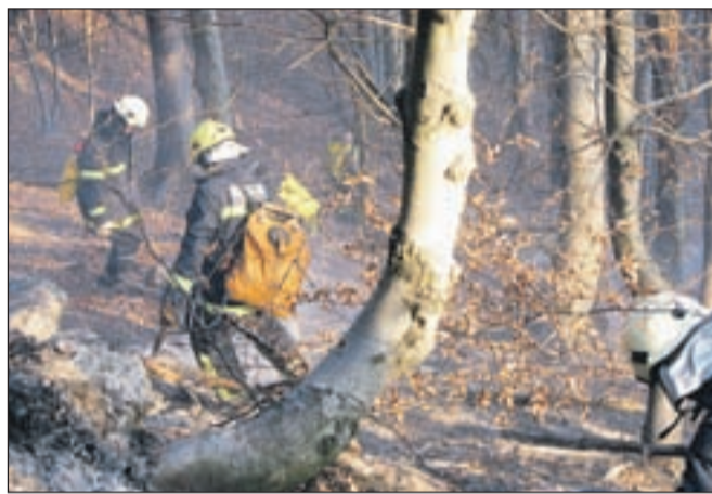
Zaradi težavnega in slabo dostopnega terena so gasilci požar v ponedeljek lahko gasili le z lopatami in naprtači, v tork pa so vzpostavili kilometrski cevovod.