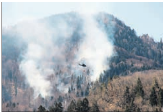
Helikopter Slovenske vojske je pomagal gasilcem pri gašenju požara in z več kot dvajsetimi preleti na požar izlil okoli 28 tisoč litrov vode.