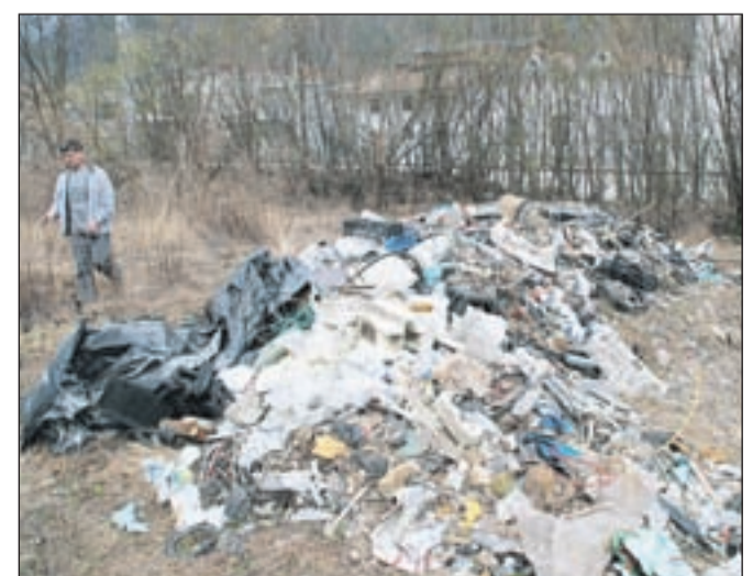
Divje odlagališče za Lidlom