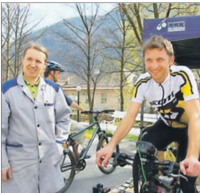
Sejem je obiskal tudi kolesarski šampion Tadej Valjavec.

BESEDILO: URŠA PERNEL