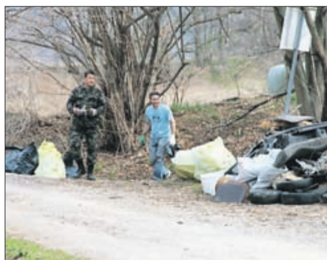
Prostovoljci pri delu na poti v Vintgar