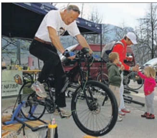
Obiskovalci so lahko preskusili kolo za generiranje električne energije.