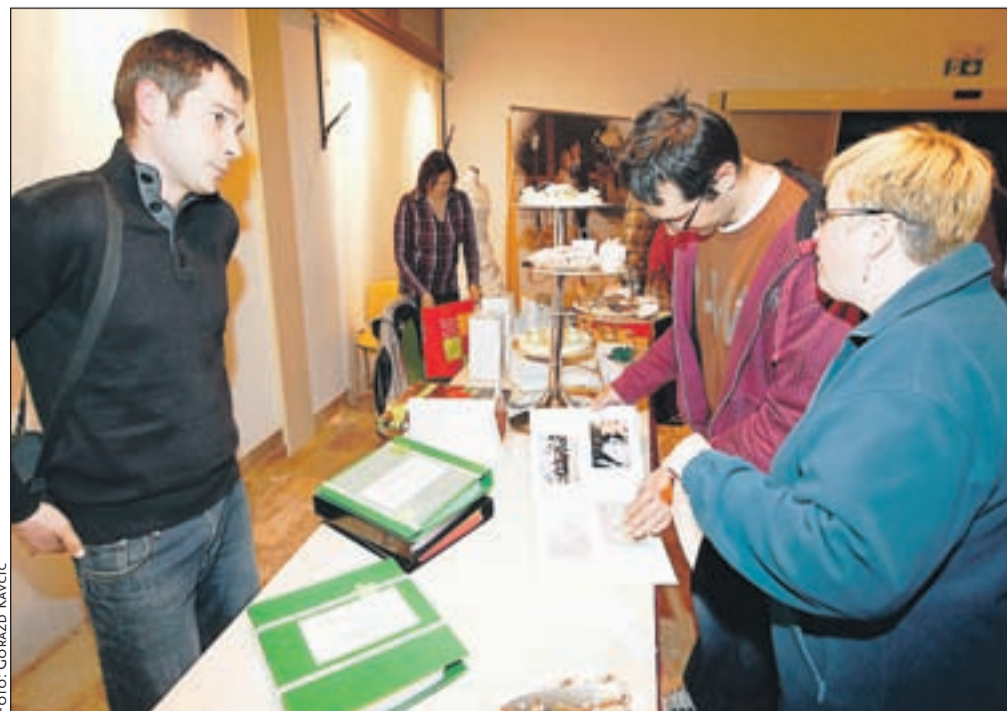
Podjetja, ki se ukvarjajo s poročno dejavnostjo, so se predstavila na stojnicah. Obiskovalci so imeli možnost pridobiti informacije iz prve roke.