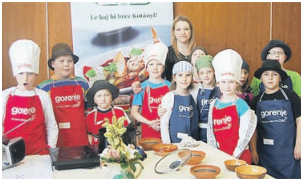
Ekipi Osnovne šole Toneta Čufarja na tekmovanju na Bledu

Vsi tekmovalci so morali pripraviti tri jedi, in sicer tako imenovano jed »na žlico«, sladico in obložene kruhke. V skupini Šefla so tako pripravili telečjo obaro in pražene iz suhih žemelj, skupina Šalca pa se je lotila gonača