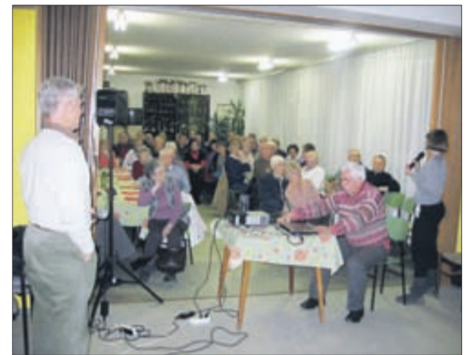
Ena od številnih prireditev v dvorani društva

„Med prvimi smo začeli izvajati projekt Starejši za starejše. Prostovoljci ob obiskih dobijo prvo sliko o njihovem življenju in težavah.