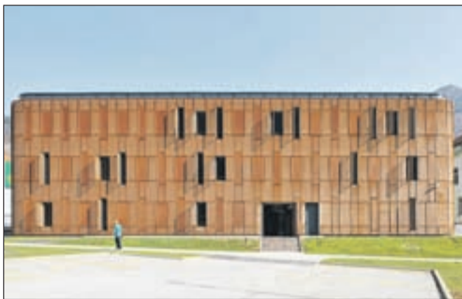
Upravni center Jesenice od zunaj ...

Sicer pa na Upravni enoti Jesenice še naprej pozivajo občane, ki jim letos poteče veljavnost osebnih dokumentov, naj pravočasno poskrbijo za njihovo zamenjavo. »V prvih treh mesecih je na območju Upravne enote Jesenice potekla veljavnost 1345 osebnih izkaznic in 2660 potnim listom. V tem obdobju smo na naši upravni enoti izdali več kot 2600 osebnih izkaznic in skoraj 1400 potnih listov. V mesecu aprilu poteče veljavnost skoraj 900 osebnih izkaznic in več kot 2400 potnim listom. Ker se konec aprila pričnejo prvomajske počitnice in s tem tudi potovanja, znova opozarjamo občane, da preverijo veljavnost svojih dokumentov in ve-