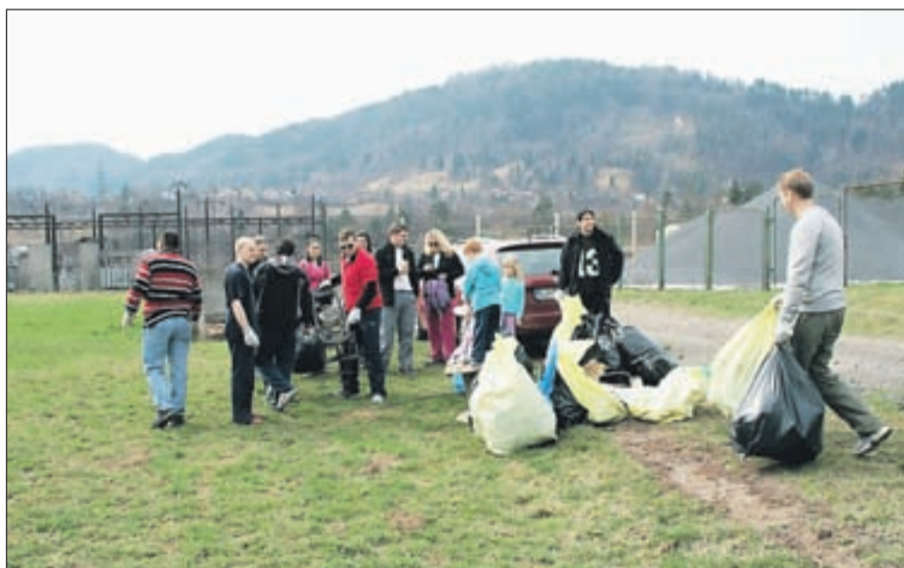
Zbrane smeti na obrežju akumulacijskega jezera Moste