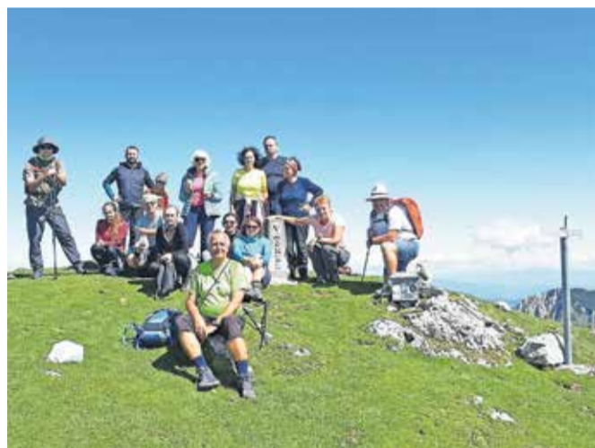
Pohodniki so zadnje avgustovsko nedeljo osvojili najvišji vrh jeseniške občine – Vajnež (2104 m).

Po jeseniških hribih je pohodniška akcija, s katero želijo občane spodbuditi h gibanju, obiskovanju domačih hribov, odkrivanju lokalnih naravnih in kulturnih zanimivosti. Pri organizaciji sodelujejo društva, TIC Jesenice in GRS Jesenice.