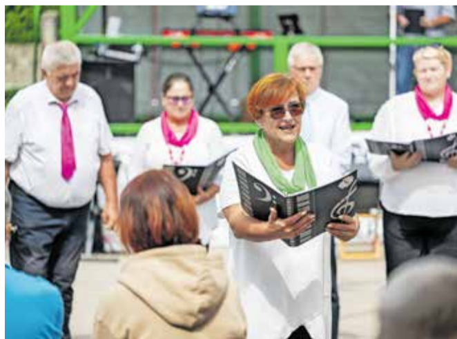
Ljudski pevci Spod Stowa so se predstavili na krajevnem prazniku na Koroški Beli.