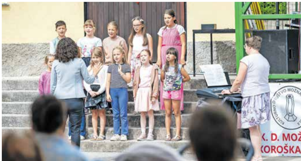
Otroški pevski zbor Škrjančki Osnovne šole Koroška Bela