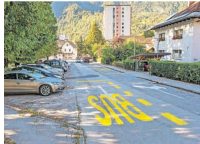
Novo avtobusno postajališče Golica pred Zdravstvenim domom Jesenice / FOTO: NIK BERTONCELJ

in Plavški Rovt–Jesenice. »Občina Jesenice ostaja vezana temu spodbujanju uporabe javnega prometa,« so poudarili in dodali, da za potnike to pomeni lažje prestopanje na mestne in medkrajevne avtobuse, krajšo in udobnejšo pot za učence, dijake, študente in občane, obenem pa imajo občani bližjo pot do zdravnika, lekarnice in trgovine.