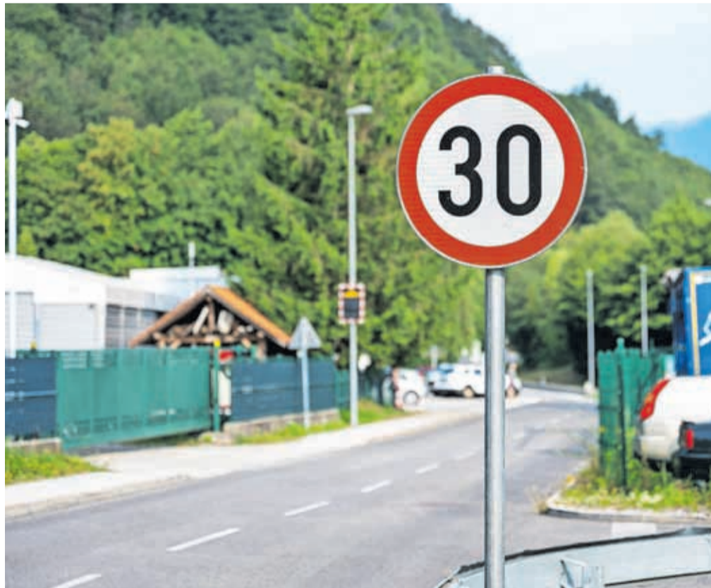
Prometni znak 30 km/h naj bi že kmalu zamenjali z novim znakom 40 km/h.

Na sestanku na Občini Jesenice so obravnavali tudi ostale sklepe in zahteve z zboru krajanov in sklenili, da bodo v začetku prihodnjega leta iz smeri Blejske Dobreve postavili še en prometni znak za omejitev hitrosti na cesti izven naselja na 70 km/h. Prav tako bodo še enkrat pozvali lastnika podjetja Yunik (in tudi vse ostale poslovne subjekte v občini)