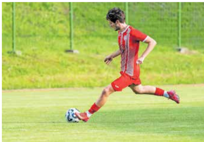
V nedeljo na Jesenicah gostuje ekipa Bilje. Tekma se bo začela ob 16. uri.