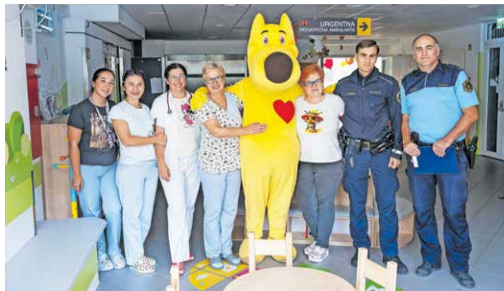
Maskota kuža Pazi z zaposlenimi na otroškem oddelku in policistoma