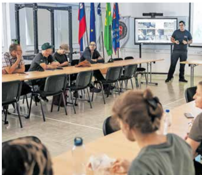
Na GARS Jesenice so jim predstavili sistem alarmiranja.

Dogodek je bil del delavnice LandAware z naslovom Znanost in praksa pri opozorilnih sistemih za zemeljske plazove. LandAware je mednarodno nevladno združenje raziskovalcev in strokovnjakov, ki se ukvarjajo z zasnovo in razvojem opozorilnih sistemov pred zemeljskimi plazovi.