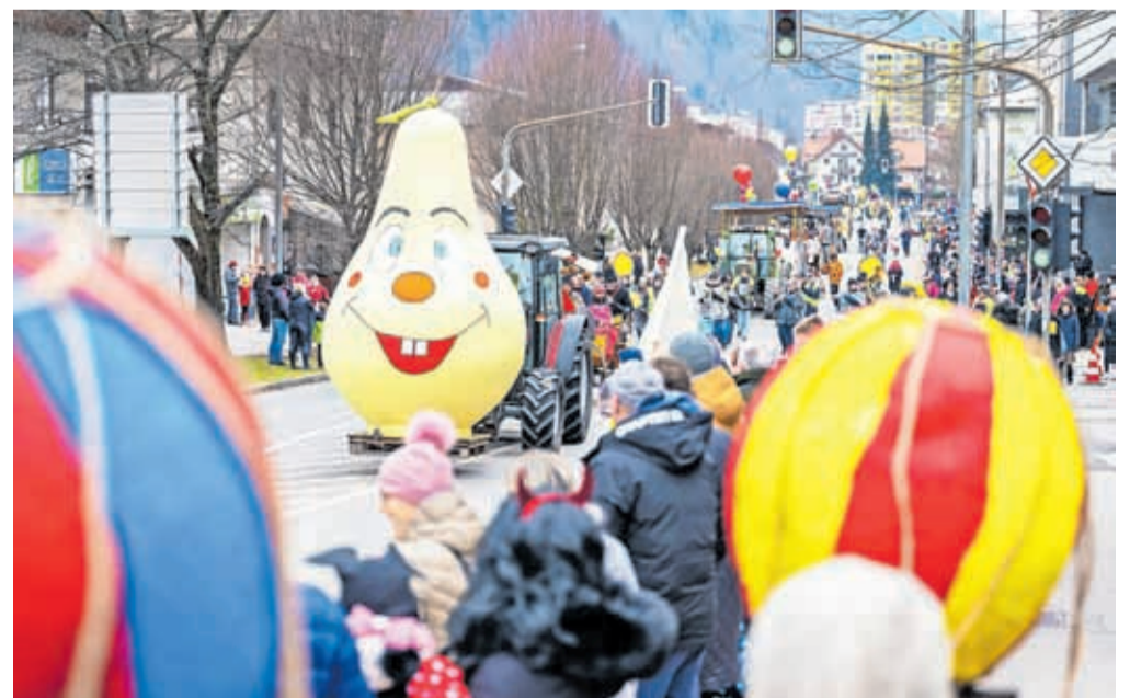
Pustna povorka se je vila s Hrušice do Čufarjevega trga, letos je v njej sodelovalo 21 skupinskih mask. / FOTO: NIK BERTONCEJ, BESEDILU URŠKA PETERNEL