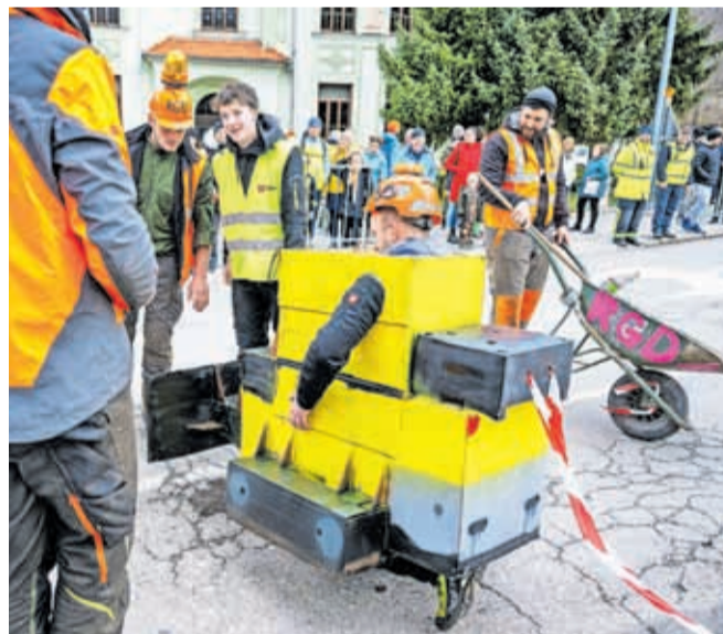
»Cesta v 'Rote' bol« so prišli povedat Rovtarji in se del lotili kar sami.