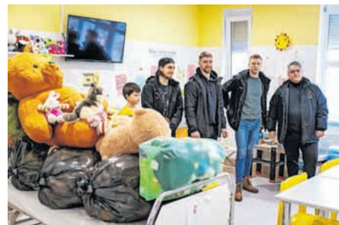
Predaja medvedkov v bolnišnici