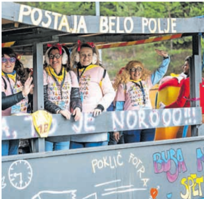
Čakanje na avtobus je eden od vaških športov na Hrušici. Avtobusa sploh ni ali zamuja, zato so uvedli mobilno avtobusno postajo na kolesih.