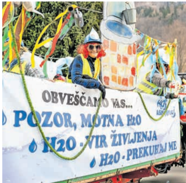
Ker je pitno vodo pogosto treba prekuhavati, so iz občine Svinjska glava prišli strokovnjaki za čisto vodo s H2O asistenco.