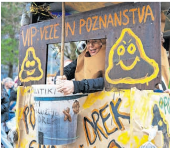
Na koncu povorke je bil voz »drekci« kot odziv na aktualno politično dogajanje.