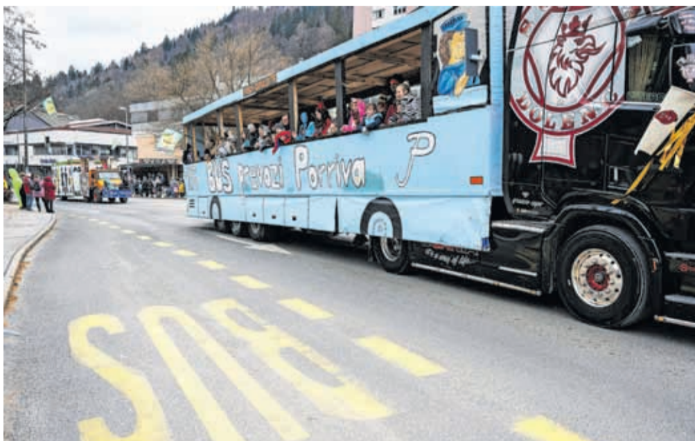
Osrednja tematika so bile težave z avtobusnimi prevozi, pustni prevoznik je postal Porriva ...