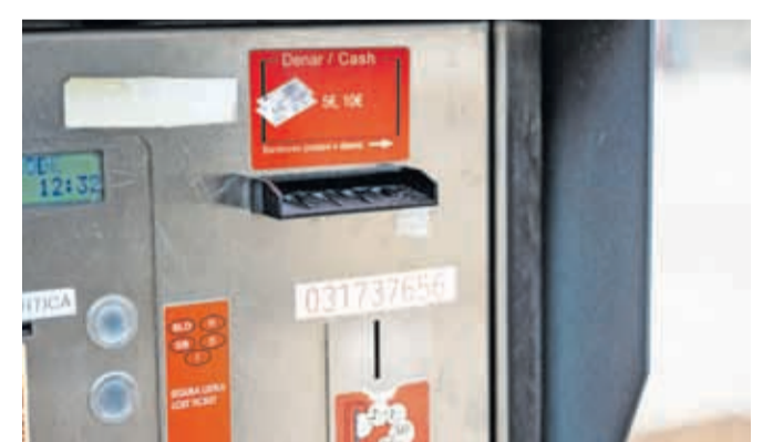
Parkomat sprejema samo kovance ter bankovce po pet in deset evrov.