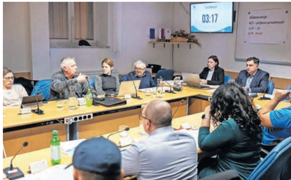
Na februarski seji občinskega sveta

Svetniki so razpravljali o dveh amandmajih k proračunu. Za postavko ohranjanje tradicij NOB in osamosvojitvene vojne za Slovenijo so podprli dodatnih dva tisoč evrov, ki jih bodo namenili spominu na 80. obletnico konca druge svetovne vojne, ta sredstva so vzeli iz postavke financiranje političnih strank. Na podlagi drugega amandmaja pa se v okviru prostorskega planiranja in stanovanjsko-komunalne dejavnosti zmanjšajo sredstva za gradnjo, nakup in investicijsko vzdrževanje stanovanj za 30 tisoč evrov in se prerazporedijo na gradnjo in vzdrževa-