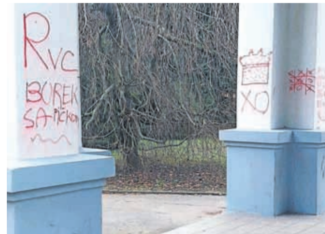
Vandali so popisali obnovljeno kapelico v Spominskem parku.

Neznanci so nedavno popisali obnovljeno kapelico v Spominskem parku na Jesenicah. Kot so opozorili na Občini Jesenice, takšna dejanja kazijo podobo mesta in povzročajo nepotrebne stroške, ki bi jih lahko namenili koristnejšim projektom. »Občina bo poskrbela za sanacijo, a ob tem pozivamo k razmisleku: je mogoče svoje misli in ustvarjalnost izraziti na način, ki ne škoduje skupnosti?« so zapisali.