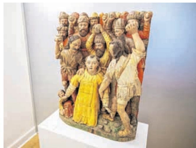
Relief kamenjanja sv. Štefana je na ogled v Mestnem muzeju Kosova graščina.