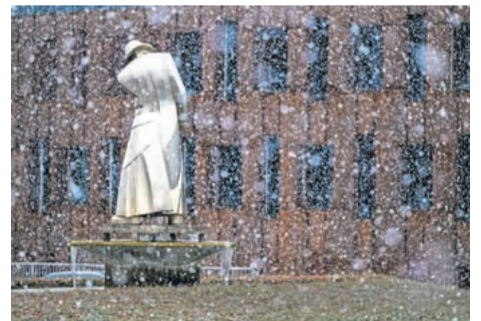
Eden od simbolov Jesenic – kip železarja

Vsako leto pred občinskim praznikom poteka tudi Kviz o zgodovini mesta Jesenice za učenke in dijake. Vsi občani pa se bodo lahko poskusili v spletni obliki kviza na spletni strani Občine Jesenice. Letošnja tema je Jesenice v vojni vihuri 2. svetovne vojne in 80. obletnica bombardiranja Jesenic.