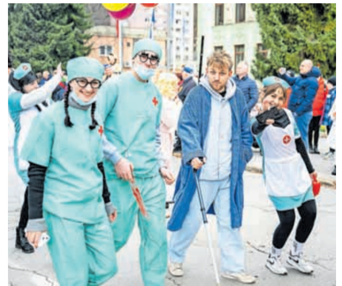
Ob težavah z lokacijo regijske bolnišnice so Hruščani ponudili Splošno bolnišnico Hrušica.