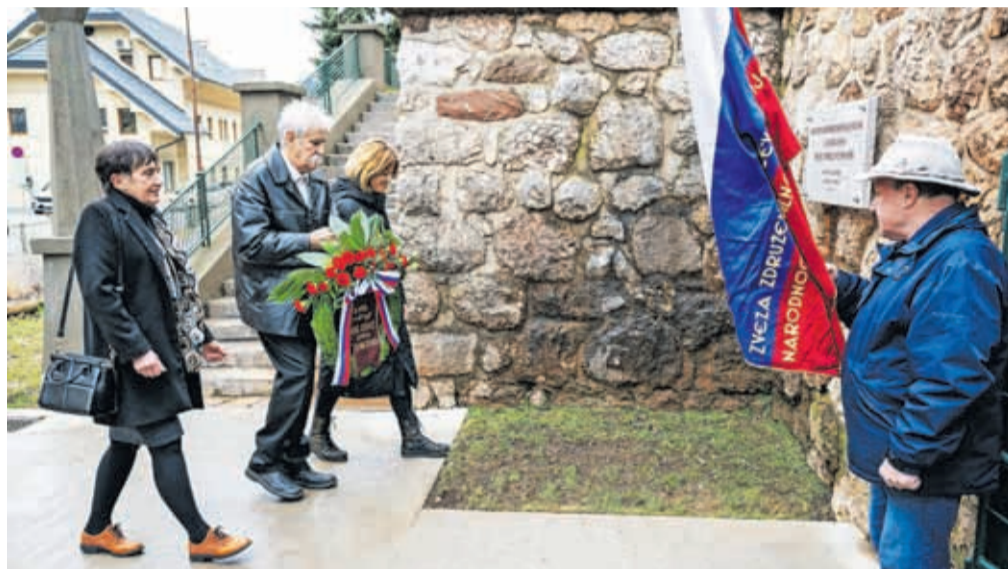
Polaganje venca k spominski tabli v Kolarjevem parku

Nemčijo. A številne bombe so zgrešile cilj in povsem razdejale mesto. Bombe so padale od gimnazije do središča mesta, od železniškega križišča do pobočja Mirce in za seboj pustile ruševine ter številne žrtve. Njihovo število ni točno znano, po različnih virih jih je bilo med 107 in 127, a je bilo število zago-