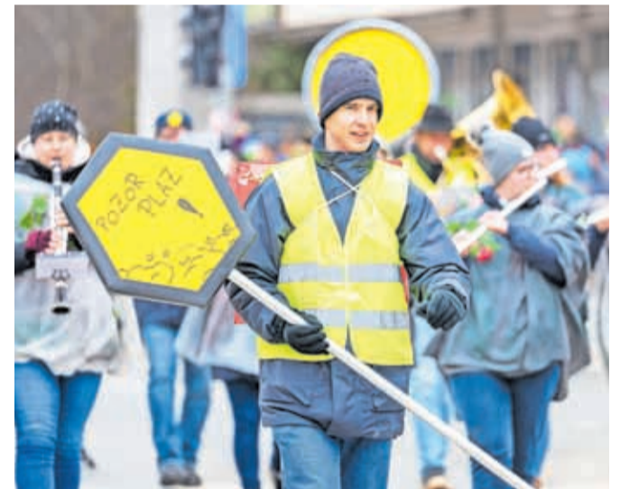
V povorki je sodeloval Pihalni orkester Jesenice - Kranjska Gora, in sicer kot reševalna služba za primer plazu na Koroški Beli.