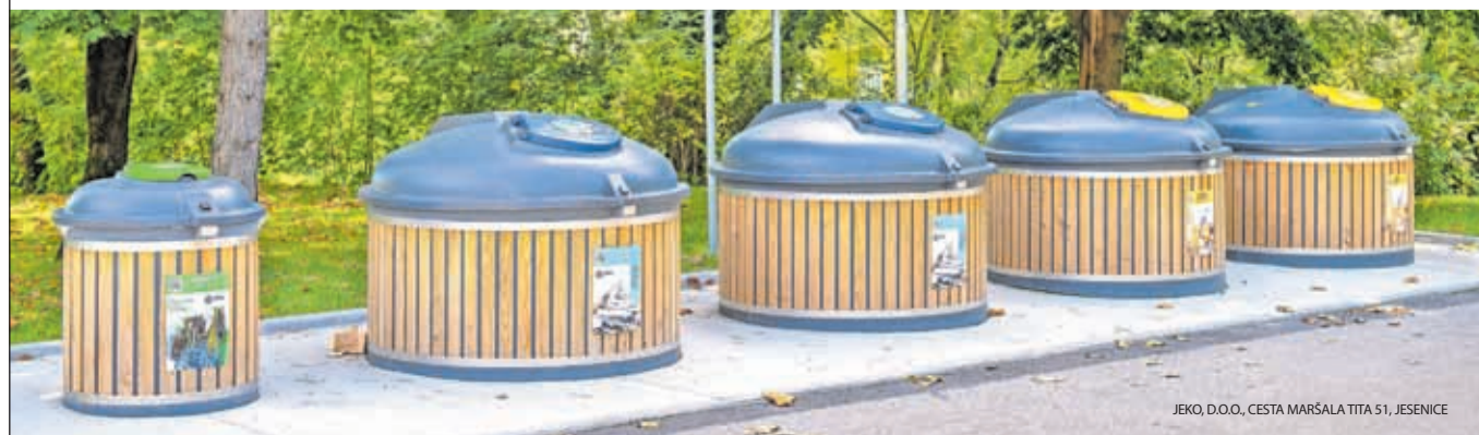
JEKO, D.O.O., CESTA MARŠALA TITA 51, JESENICE

nih odpadkov v mešanih komunalnih odpadkih in prispevati k učinkovitejšemu kroženju surovin. O tej spremembi smo že podrobneje pisali v prejšnjih številkah časopisa. Poleg rednega zbiranja odpadkov smo v letu 2024 nadaljevali pranje zabojnikov, ki je potekalo med aprilom in novembrom, ter razširili mrežo podzemnih zbiralnic. V občini Jesenice jih je zdaj že 26, kar pripomore k večji urejenosti in zmanjšanju neprijetnih vonjav. Zbirni center Jesenice je v letu 2024 obiskalo 16.674 uporabnikov, smetarska vozila pa so skupaj prevozila 107.804 km, kar kaže na obsežnost zbiranja in odvoza odpadkov v občini. Čeprav smo na področju ravnanja z odpadki dosegli pomembne premike, ostaja ključni izziv ozaveščanje prebivalcev o pravilnem ločevanju in zmanjšanju količin odpadkov. S skupnimi prizadevanji lahko v prihodnje še izboljšamo kakovost okolja v naši občini.