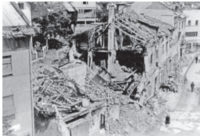
Jesenice, porušene v bombnem napadu 1. marca 1945, na izvorni fotografiji iz fototeke Gornjesavskega muzeja Jesenice, kjer hranijo okrog trideset fotografij posledic bombardiranja.