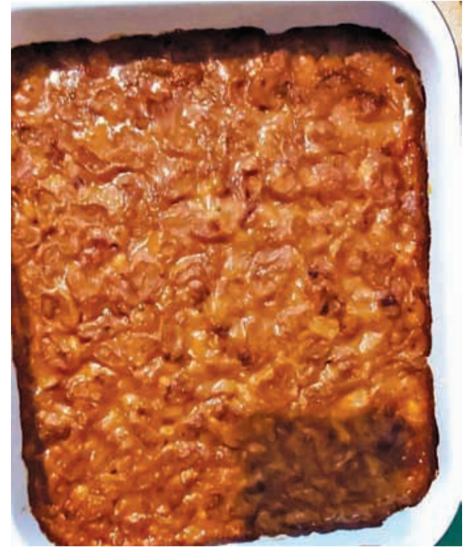
Gravče na tavče je tradicionalna makedonska specialiteta.

renčka, 1 zelena, rdeča in rumena paprika, listi peteršilja, suho meso ali klobase, sol, začimbna mešanica z vrtninami, poper, mleta sladka paprika, feferoni po želji Priprava: Fižol, ki smo ga prej namočili, skuhamo. Pustimo ga v vodi, v kateri se je kuhala (fižola iz konzerve ni treba kuhati). Nato čebulo popražimo, da postekleni, dodamo papriko, korenje, česen in vse skupaj malo pražimo, da se zmehča. Dodamo začimbe (pazimo, da ne solimo preveč, saj je suho meso slano). Pekač namažemo z oljem. V pekač stresemo vso zelenjavo, ki smo jo dobro premešali. Dodamo suho meso in čez vse stresemo fižol. Zmes zalijemo z vodo, v kateri se je kuhala fižol. Nato zmešamo veliko žlico moke v nekaj žlic vode in žlici rdeče paprike ter prelijemo čez vse. Pečemo 25 minut v ogreti pečici na 180 stopinjah Celzija.