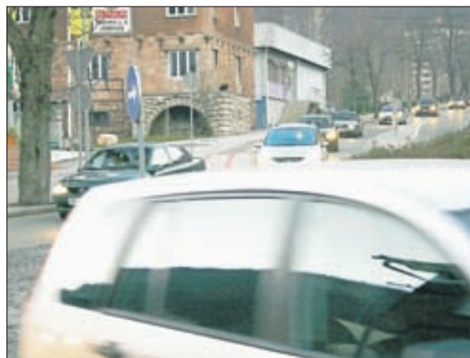
V okviru akcijskega programa varstva okolja bodo vzpostavili mrežo za merjenje onesnaženosti tal in zraka na Jesenicah.

onesnaženosti tal bodo izvedli v drugi polovici prihodnjega leta, onesnaženosti zraka pa leta 2013 v kurilni sezoni. Med novostmi je Goriškova omenila še popis in spremljanje stanja indikatorskih vrst invazivnih rastlin ambrozije in dresnika, ki sta močna rastlinska alergena, rasteta pa zlasti ob železniški progi in cestah. Občinski svetniki so poročilo sprejeli, obenem pa sklenili še, da naj se družba Acroni pozove, da Občini Jesenice predloži poročilo o spremljanju vpliva odlagališča PTO Slovenski Javornik na podzemne vode v letu 2010 in da na občinskem svetu poroča o rezultatih spremljanja onesnaženosti zraka zaradi dodatnega vpliva obratov družbe Acroni.