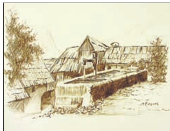
Marjan Židanek: Korito na Murovi (rjava kreda)