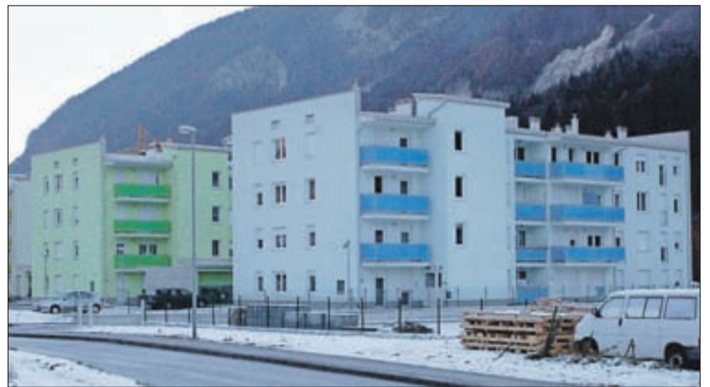
Občina Jesenice je najemnike novih stanovanj na Prešernovi izbrala na osnovi razpisov dodelitev neprofitnih stanovanj, glede na uvrščenost na prednostno listo prosilcev.

recno prepovedano, puščajo odklenjena vhodna vrata, ker se jim ne ljubi nositi ključev, pol ure zatem, ko čistilka počisti hodnik, je že spet vse umazano ... Čeprav imamo nameščene ekološke otoke, so zabojniki za mešane odpadke polni steklenic, škatel ..., " nam je povedal predstavnik sveta etažnih lastnikov. Lastniki stanovanj so se z novimi sosedi