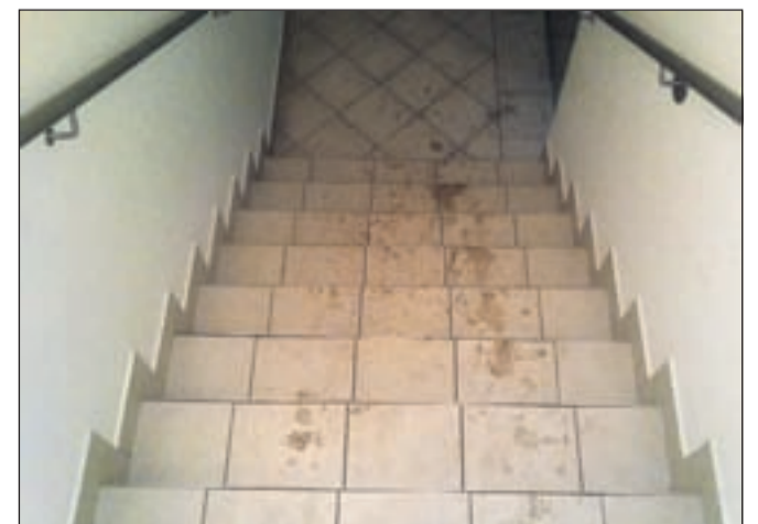
Umazano stopnišče nekaj ur zatem, ko ga je čistilka počistila.