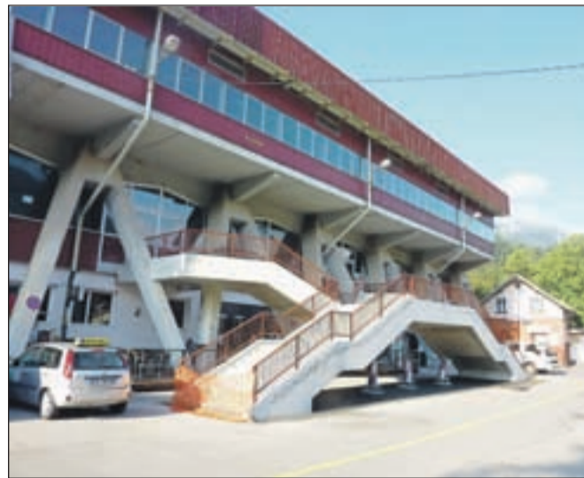
Med večjimi investicijami v letu 2012 bo nadaljevanje obnove Športne hale Podmežakla.