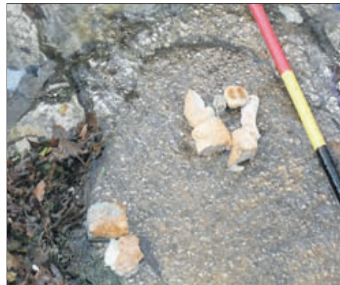
V potoku Ukova pod mostom na Aljaževi ulici si je neznan ljubitelj rib omislil nekakšno ribogojnico in za začetek v strugo vložil kar veliko količino kruha, predvsem štruce in žemlje. Bo naslednji korak naselitev rib? Vsekakor je tako metanje kruha alarmantno ... | BESEDILO IN FOTOGRAFIJA JANEZ PIPAN