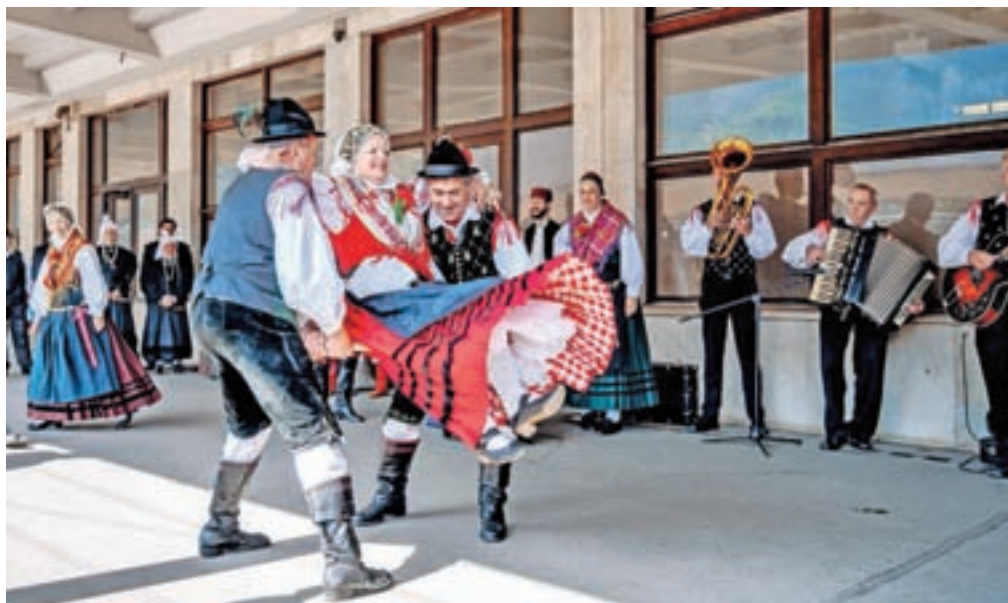
Gostom so se predstavila jeseniška kulturna društva.