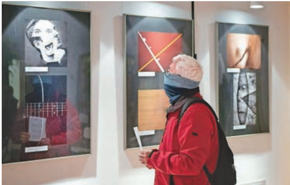
Razstava Abstract 2020 bo v banketni dvorani v Kolpernu na ogled do 23. oktobra v času dogodkov.

neusmiljene kritike sorodnih pogledov, a precej različnih korenov.« Pelko je še v imenu žirije apeliral na nagrajence, naj ne počivajo na lovorikah in naj se vedno znova podajo na nova brezpotja, drugim udeležencem pa svetoval, naj razmislijo, kaj bi lahko izboljšali.