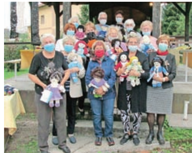
Sodelujoče pri projektu Posvoji punčko in reši otroka