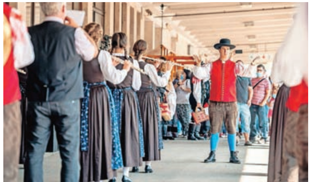
Nastopil je Pihalni orkester Jesenice - Kranjska Gora.