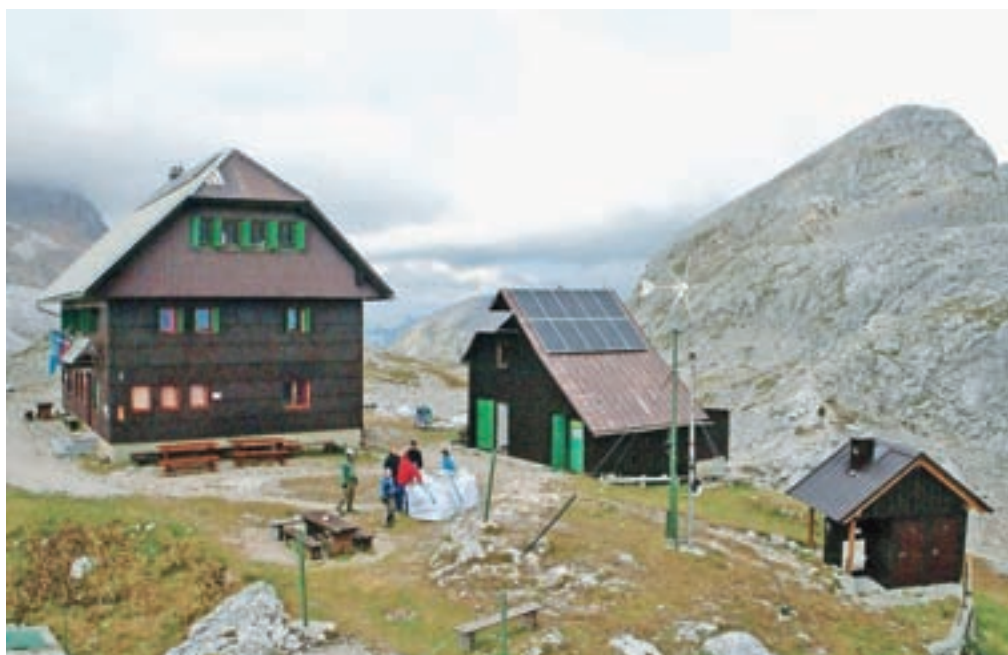
V planinski koči Dom Valentina Staniča pod Triglavom (2332 m n. m.) električni generator na fosilna goriva ni več potreben, elektriko pridobivajo z energijo sonca in vetra.