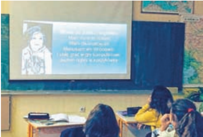
Učenci iz različnih držav so drug drugega učili svojih jezikov.