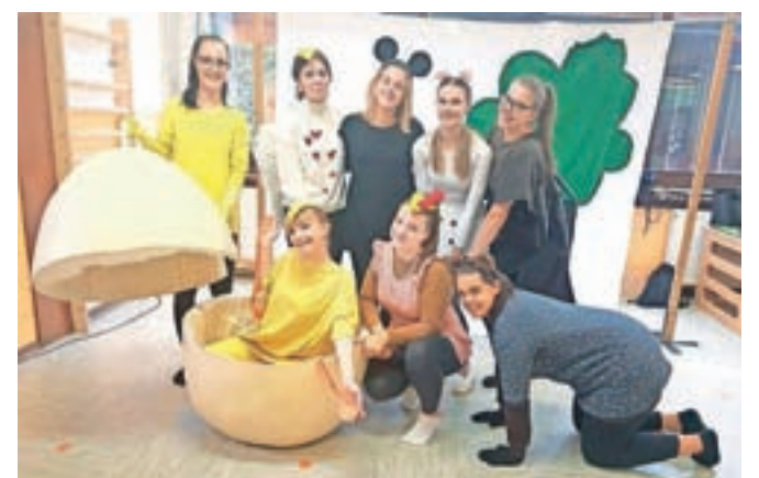
Igrico Piščanček Pik je odigrala skupina dijakin iz 4. AV.