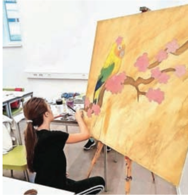
Njeni učenci se naučijo različnih slikarskih postopkov in tehnik, opazovanja, projektne dela ...

se notranje umirijo. Sama jim v slikarski šoli želi dati ne le slikarsko znanje, ampak vso podporo na njihovi poti osebne rasti. Ob tem pa je prepričana, da je tudi pri slikanju bolj kot talent pomembno veselje do ustvarjanja in dovolj vaje.