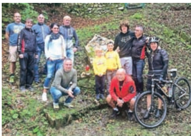
Družinski člani in prijatelji so se zbrali pri spominskem obeležju v Plavškem Rovtu.

ganizirali kolesarski izlet do spominskega obeležja v Plavškem Rovtu, kjer so se zbrali ožji družinski člani in prijatelji. Vsako leto aprila sicer pripravijo kolesarski izlet do Juretovega groba v Kranjski Gori, letos pa ga zaradi koronavirusa niso organizirali.