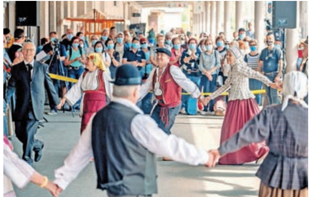
Obiskovalcem so pokazali, kar Jesenice najbolj odlikuje – prijateljstvo, prijaznost, multikulturalnost, sožitje in gostoljubje.