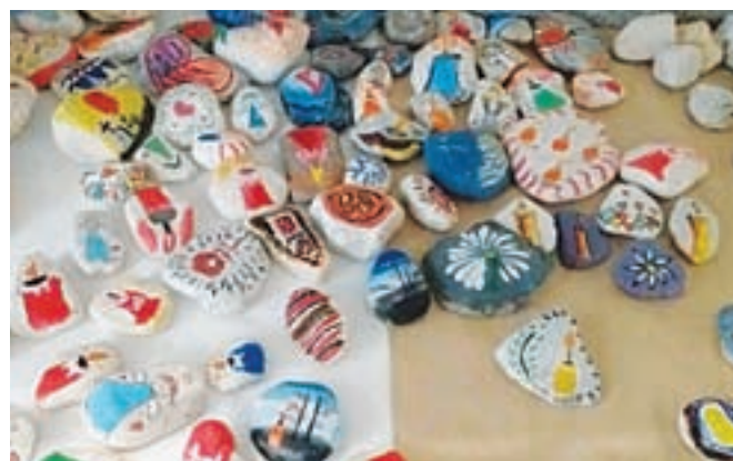
Fotografija še nedokončanih kamnov, ki nastajajo pod okriljem Ljudske univerze Jesenice v projektu »Ne plastiki«.

Namesto, da v spomin na umrle prižigate sveče, vam predlagamo, da izdelate ali kupite okrašene kamne in se z njimi spomnite na pokojnike. Ljudska univerza Jesenice, v okviru projekta Socialna aktivacija Gorenjske, v kate-