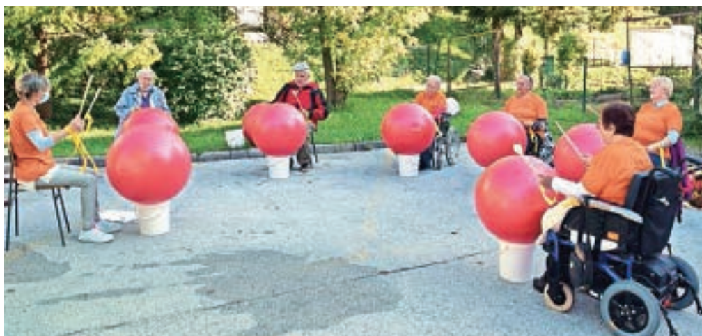
Nastopil je tudi domski Žoga bend.

Praznovanje je potekalo na prostem, praznovali so tako stanovalci kot zaposleni.