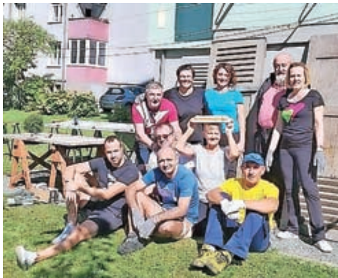
Stanovalci so si delo popestrili z dobro voljo.

kletnih vrat ter organizirali skupen odvoz kosovnih odpadkov. Delo so si popestrili z dobro voljo, hišne gospodinje pa so poskrbele za pecivo in pijačo. Tako je vsak prispeval po svojih močeh, kot pravijo, pa je najpomembnejše, da so še okrepili medsebojno složnost, sodelovanje in dobre sosedske odnose. Aktivnosti še niso zaključili, saj že načrtujejo naslednje akcije, s katerimi želijo biti zglede in primer dobre prakse složnega sobivanja.