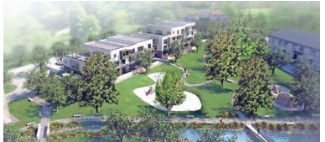
Takole naj bi bila videti nova večstanovanjska objekta na Jesenicah.

Sklad se na Gorenjskem pripravlja na še eno gradnjo, in