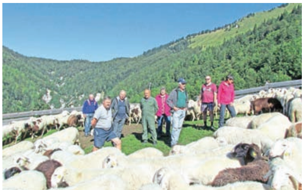
Člani Agrarne skupnosti Planina pod Golico z letošnjim tropom ovc

sedaj vedno okoli štiristo. Po podatkih članov ovčarske sekcije je bilo največ ovc leta 1984, in sicer se jih je pod Golico paslo več kot šeststo. Ker jih domačini sami v kraju nimajo dovolj, jih imajo poleti na paši tudi lastniki iz drugih krajev, največ iz Gorij in Zasipa.