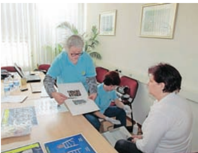
Meritve se je udeležilo kar sedemdeset krajanov.