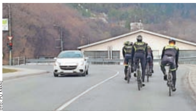
Vzporedno kolesarjenje je nevarno in tudi prepovedano.

Na cestah se že pojavljajo kolesarji posamezniki in skupine, kolesarska sezona pa se počasi začne. "Vožnja po sredini vozišča ali situacije, ko kolesarji uporabljajo ves prometni pas, so zanje nevarne, dejanje je prepovedano in zelo ovira promet. Zato opozarjamo, da mora biti vsako kolesarjenje v skupini varno, skupine naj bodo manjše (do pet kolesarjev), kolesarji pa naj vozijo eden za drugim na ustrezni razdalji. Če je skupina večja, naj se razdeli na več manjših, tako da jih bodo vozniki lahko varno prehiteli. Vzporedno kolesarjenje po največ dva kolesarja je dovoljeno samo z licenco kolesarske zveze in ustreznim spremstvom, sicer pa ne. Kolesarji sodijo v skupino ranljivejših udeležencev, v nesrečah redko ostanejo nepoškodovani, pojavljajo pa se tudi v smrtnih prometnih nesrečah," opozarja Bojan Kos s Policijske uprave Kranj.