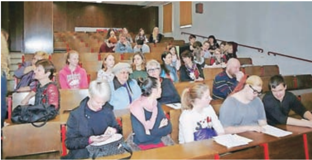
Otroški parlament je letos gostila Osnovna šola Prežihovega Voranca Jesenice.

Medobčinski otroški parlament na Jesenicah koordinira Zveza društev prijateljev mladine Jesenice.