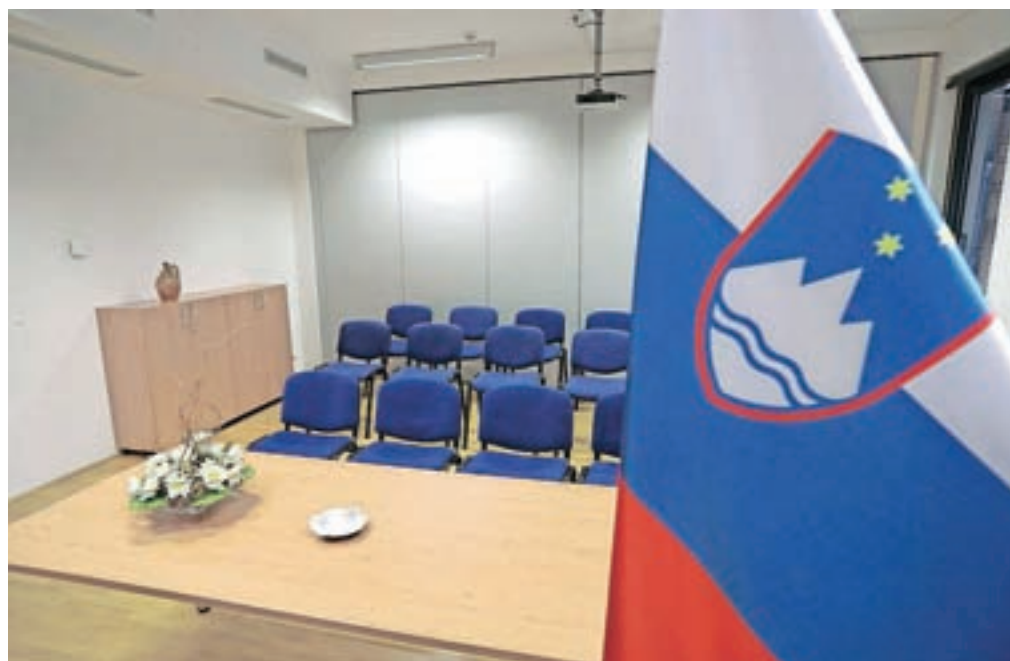
Prostor za sklepanje zakonskih zvez je odslej tudi v konferenčni dvorani Upravne enote Jesenice.

Na upravni enoti pa že vse od leta 1997 redno merijo tudi zadovoljstvo strank. "Zadnje merjenje oziroma anketo smo izvedli leta 2016 in zelo nas je razveselilo, ko so nas stranke ocenile z oceno 4,86, kar je nad povprečjem upravnih enot. Tak rezultat pa pomeni tudi spodbudo za naprej. Sicer se ankete izvajajo vsaki dve leti in med 3. in vključno 18. aprilom letos bomo anketo ponovno izvedli. Istočasno pa sodelujemo v pilotnem projektu Ugotav-