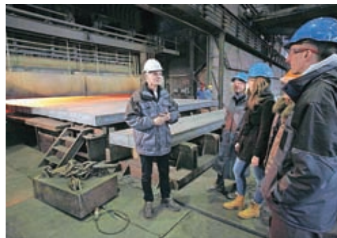
Predstavili so celotno proizvodno pot jekla in pokazali obrata Vroča in Hladna valjarna.

Med obiskovalci so bili tako osnovnošolci kot srednješolci s starši in starimi starši, mlajši zaposleni s svojimi otroki in tudi upokojeanci.