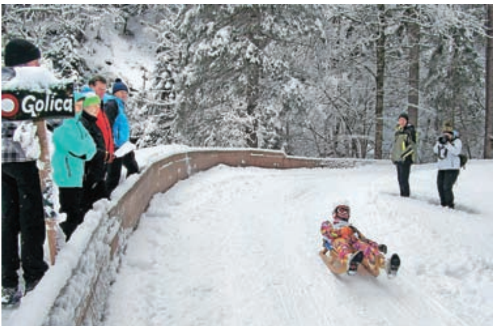
Nastopilo je enainpetdeset tekmovalk in tekmovalcev.

Prvo mesto na 57. Pokalu mesta Jesenice je z najboljšo ekipno uvrstitvijo zasedla ekipa Sankaškega kluba Idrija pred ekipo Športnega društva Lom in ekipo Domel Železniki. Četrto mesto je zasedla ekipa Športnega društva Podlublje in peto mesto ekipa domačega Sankaškega kluba Jesenice.