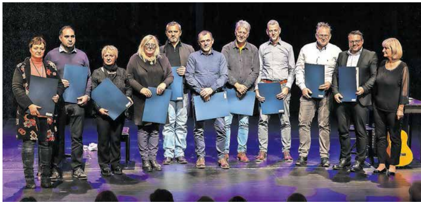
Prejemniki jubilejnih priznanj za dolgoletno opravljanje dejavnosti

Priznanja je prejelo 28 obrtnikov, od tega 17 iz jeseniške občine.