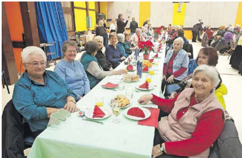
Zbralo se je lepo število starejših.