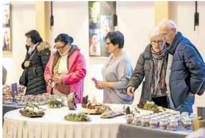
Obiskovalci so lahko uživali v pestri ponudbi izdelkov, ki so jih pripravili člani društva. Venčki so pošli najhitreje.