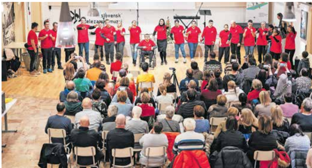
Nastopilo je tudi domače društvo Lepa si.