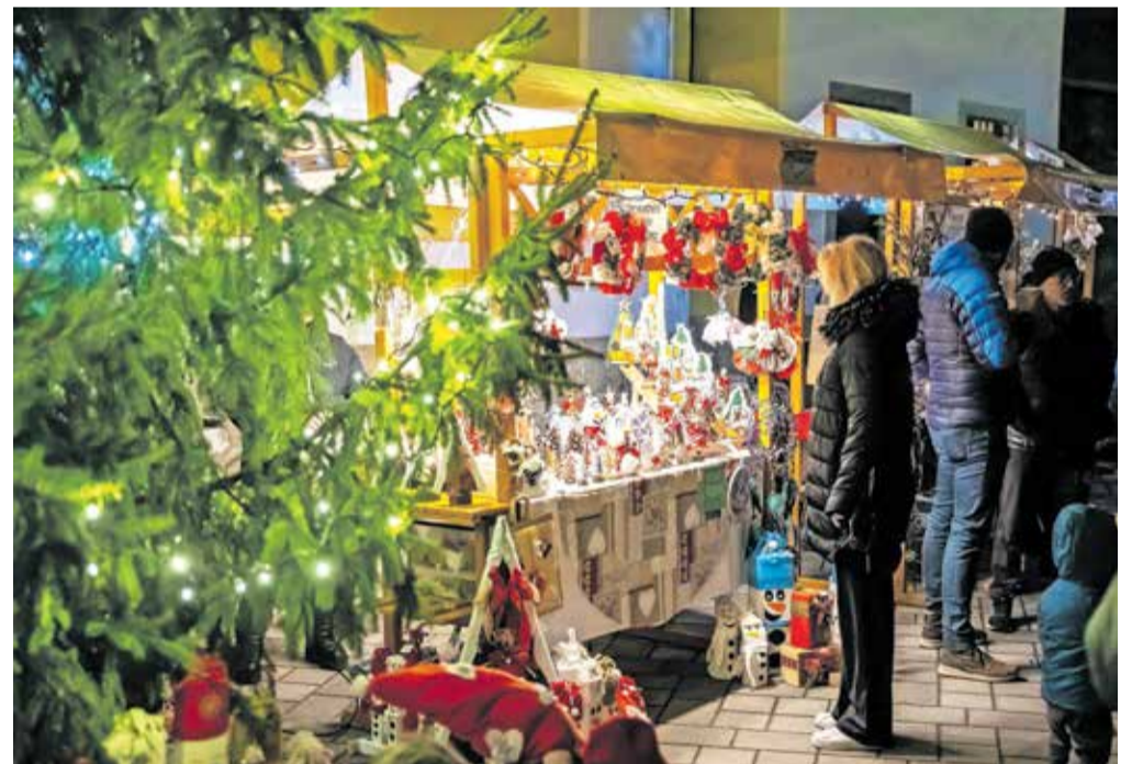
Letos so na dvorišče ob cerkvi postavili kar šestnajst prazničnih stojnic, na katerih so se predstavljali domači ponudniki izdelkov ter društva.