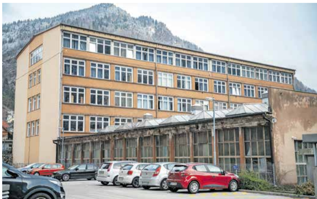
Srednja šola Jesenice na prenovo čaka že dvajset let. Šolska stavba je bila zgrajena leta 1949 in nadzidana leta 1978.

Investicija je vredna dobrih dvajset milijonov evrov, zanj pa so pridobili denar iz načrta za okrevanje in odpornost. Kot je dejala, bo nova šola moderna, lepa in bo omogočala vrhunske pogoje za izobraževanje. Staro šolo bodo v celoti porušili, na novo pa zgradili