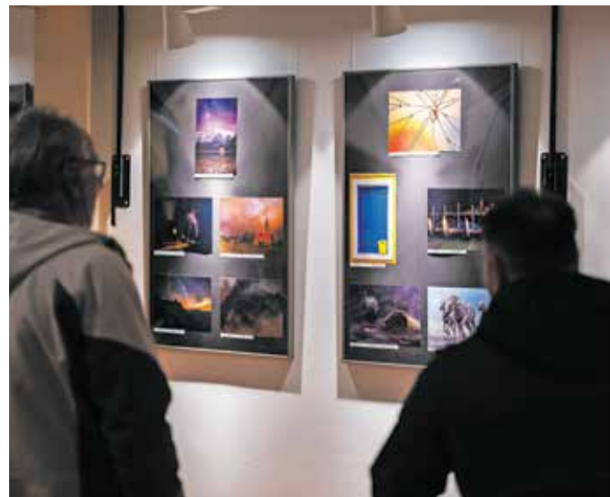
Odpрте fotografske razstave ENA/a