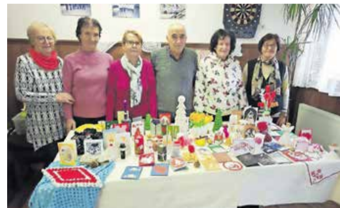
Na ogled je bila razstava ročnih del z ustvarjalnih delavnic.