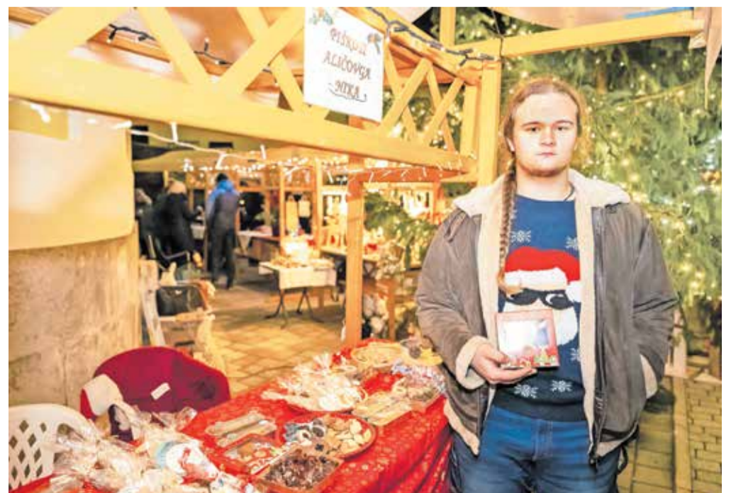
Stojnica Nika Laharnarja s piškoti Aličovga Nika