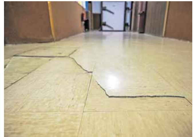
Zaradi žlindre so tlaki v kletnih prostorih dvignjeni in razpokani.

je iz njih zaudarjalo, a stanje tudi zdaj ni bistveno boljše. Dotrajane so tudi sanitarije v višjih nadstropjih, zlasti v enem od stranišč je cela stena »napihnjena« in je samo vprašanje časa, kdaj bodo ploščice odpadle; in upati je, da ne bo ravno takrat v stranišču kateri od učencev. Stara in uničena so tudi vrata sanitarij. Po predračunu bi samo obnova sanitarij stala 117 tisoč evrov, po besedah ravnateljice pa so na Občini Jesenice v osnutku proračuna za leto 2025 ta denar za investicijska vzdrževalna zdaj