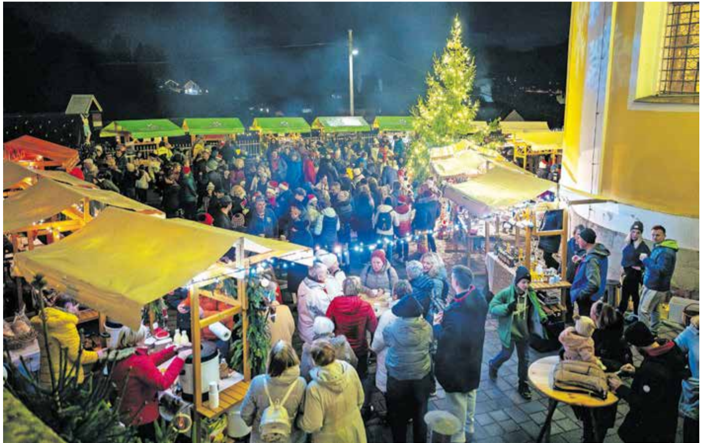
Glavni namen Adventne tržnice je predvsem druženje v predprazničnem času.