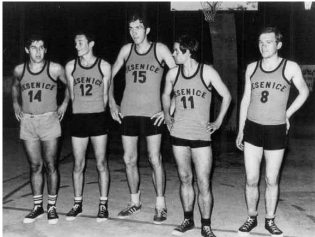
V Košarkarskem klubu Jesenice je nosil številko 15.