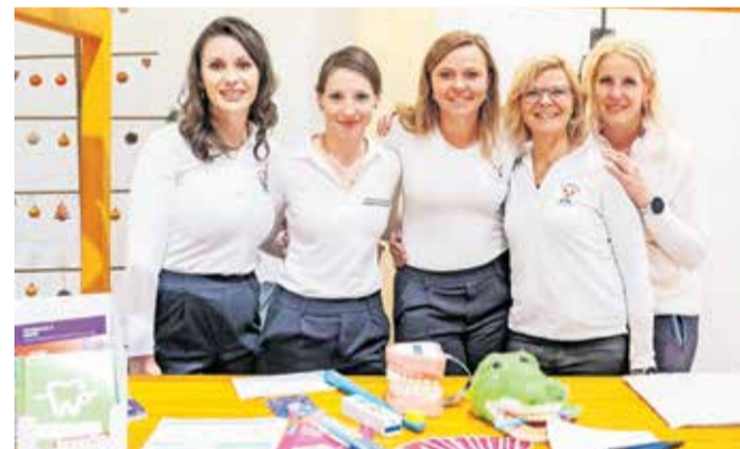
Ekipa Zdravstvenovzgojnega centra Jesenice