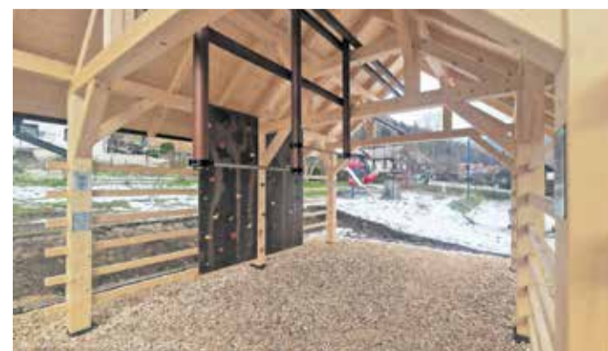
Športnovadbeni kozolec na Kočni je zdaj opremljen tudi s športnimi rekviziti.

Projekt postavitve športnovadbenega kozolca na Kočni, izveden v sklopu participativnega proračuna, je zaključen. Pred dnevi so vanj namestili še športne rekvizite, ki bodo omogočili vadbo in igro mladim ter tudi ostalim obiskovalcem.