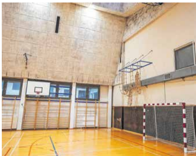
Telovadnica je energetsko potratna, zaradi žlindre je na določenih mestih parket dvignjen.

Občina Jesenice je v obnovo šole v preteklih letih vložila že ogromno denarja, a ker je bil objekt zgrajen slabo, se kažejo nove in nove potrebe po obnovi.