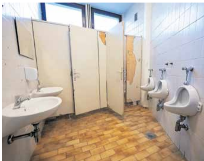
Sanitarije v prvem nadstropju so dotrajane, pravzaprav sramotne, je dejala ravnateljica.