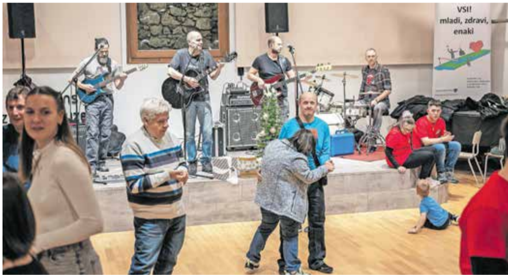
Za večerni Žur z namenom so tokrat zadolžili skupino Joške v'n, ki je poskrbela za odlično zabavo. Zavrtelo se je staro in mlado.