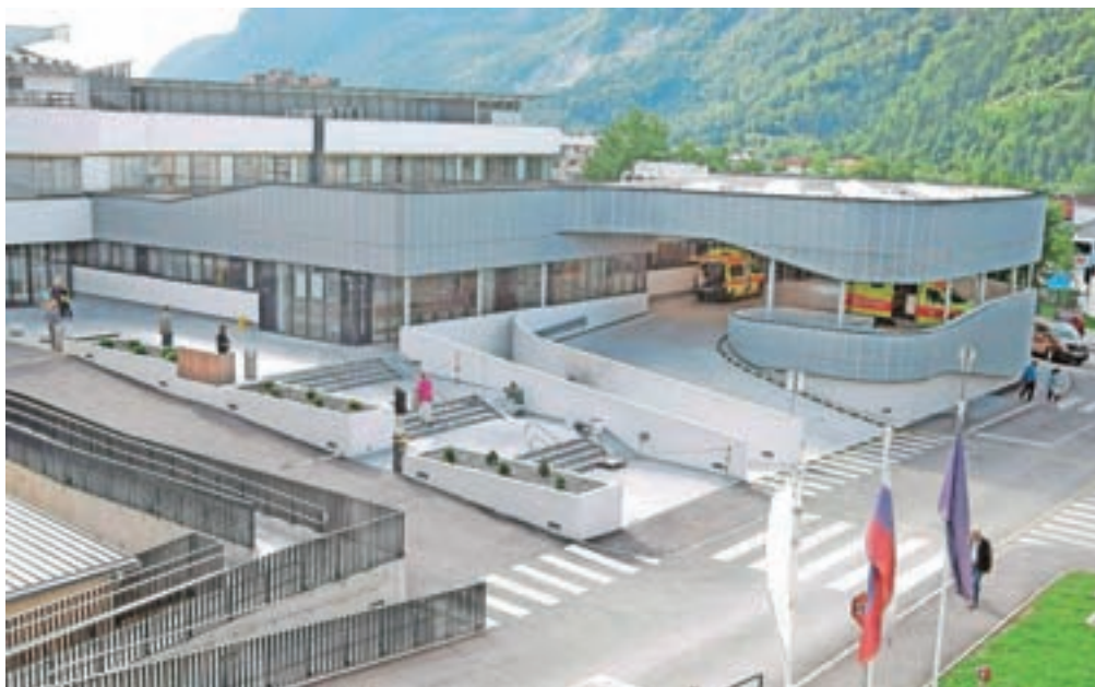
Splošna bolnišnica Jesenice mora ostati na Jesenicah, so odločeni na Občini Jesenice.

V javnosti so se v zadnjem času pojavile pobude za gradnjo nove regijske bolnišnice v Radovljici. Na to so se burno odzvali na Jesenicah, in sicer tako na Občini Jesenice kot tudi številni občani s svojimi zapisi na Facebooku. Na Občini Jesenice so v podkrepitev svojim argumentom, zakaj mora dejavnost splošne bolnišnice ostati na Jesenicah, začeli zbirati tudi podpise občanov. Tako je na spletni strani občine objavljena e-peticija, s katero lahko občani izrazijo svojo podporo ohranitvi dejavnosti splošne bolnišnice na Jesenicah. Peticija bo dostopna še mesec in pol, do minulega torika pa jo je podpisalo že več kot 2400 ljudi. Stran s peticijo omogoča, da svoj podpis oddajo tudi tisti, ki nimajo svojega elektronskega predala, in sicer lahko s strani natisnejo obrazec, ki ga lahko lastnoročno izpolnijo in podpišejo, nato pa ga sami naložijo nazaj na stran ali to stori nekdo v njihovem imenu. V kolikor potrebujejo dodatno pomoč, lahko podpis uredijo in oddajo tudi v