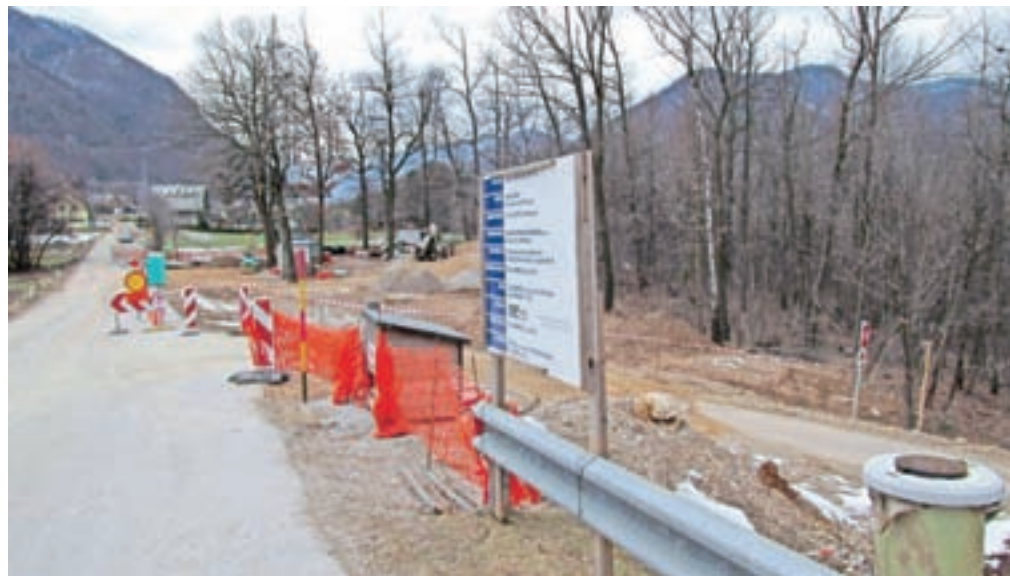
Junija lani se je začela gradnja kanalizacije Lipce, ki se je konec decembra zaradi vremenskih razmer začasno ustavila in se bo nadaljevala, ko bodo razmere dopuščale.

Na seji občinskega sveta so potrdili tudi predlog Lokalnega programa za kulturo občine Jesenice 2021–2024. Gre za strateški dokument, ki postavlja prioritete na področju kulture, ki mu bodo tudi v prihodnje namenili posebno pozornost. Med strateškimi cilji so zlasti zagotavljanje ustreznih prostorskih pogojev za delovanje osrednjih kulturnih ustanov in povečanje števila obiskovalcev v vseh, zlasti pa zgodovinskega območja Stare Save.