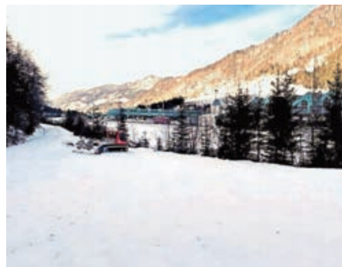
... daljši pa pri platoju Karavanke, kjer bodo progo po nedavni odjugi skušali ponovno urediti.