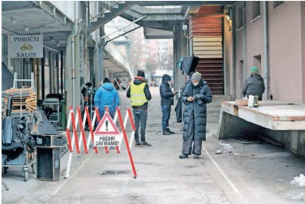
V centru Jesenic je padla prva klapa za novi slovenski celovečerec Zbudi me .