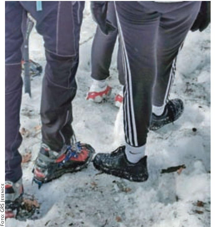
Gorske reševalce sta na pomoč poklicali učenci, ki sta v neprimerni obutvi obtičali v ledu Jelenkamna.

Opozorilo o ustreznosti opremljenosti velja za vse, ki se podajajo tudi višje v hribe. "Pozivamo obiskovalce gora, naj upoštevajo opozorila in v