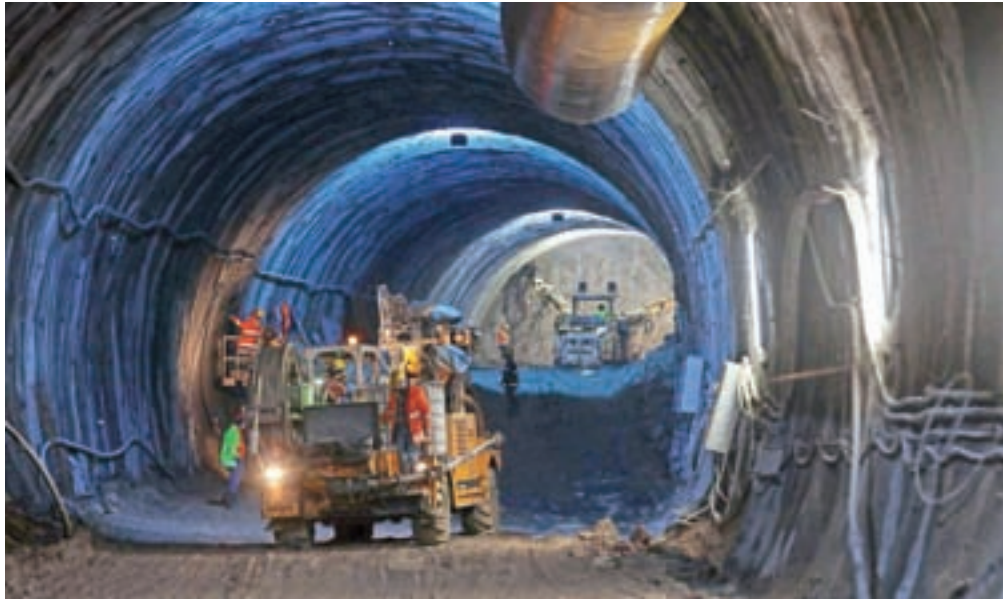
Prejšnji petek so v enem dnevu izkopali rekordnih enajst metrov druge cevi.

So pa pred kratkim med turškimi delavci zaznali nekaj okužb s koronavirusom, izolirali so jih v samostojnem objektu znotraj kontejnerskega naselja na Hrušici, kjer bivajo. Vse preostale večkrat na teden testirajo, trenutne razmere pa narekujejo tudi čim večjo izoliranost delavcev, ki imajo le najnujnejše stike izven naselja oziroma delovišča. Na projektu sicer dela 98 delavcev, od tega je 83 turških. Spomnimo, izvajalca so na