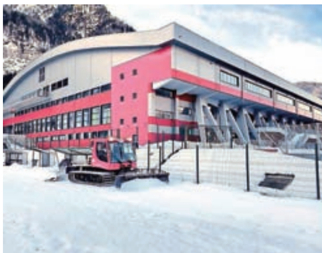
Krajši krog za tek na smučeh je bil ureden na atletski stezi v Športnem parku Podmežakla ...

Progi je sicer v začetku tedna uničila odjuga, a kot so zagotovili na Zavodu za šport Jesenice, ju nameravajo ponovno urediti, če bo le ostalo dovolj snega in bo dovolj hladno.