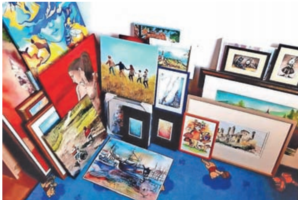
Na dražbi je okrog štirideset umetniških del, ki so jih podarili gorenjski umetniki.