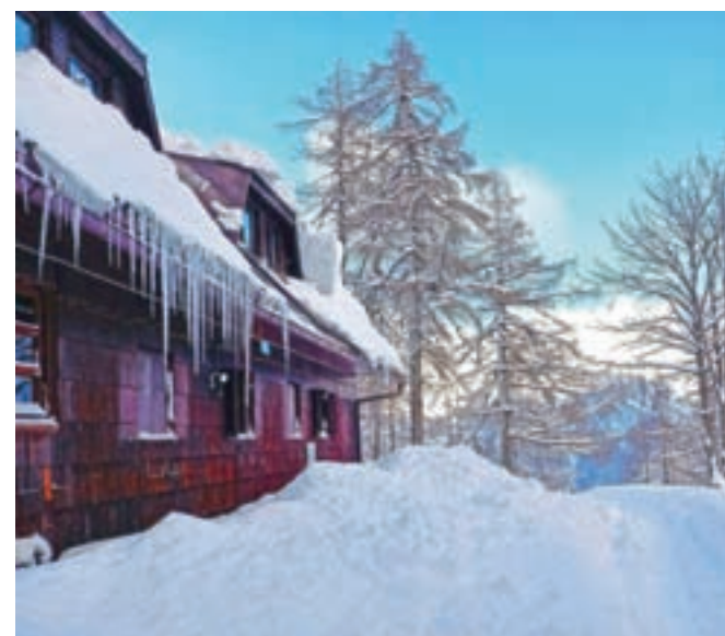
Erjavčeva kočica v letošnji zimi

Sedaj se na Vršič podajo predvsem tisti bolj pogumni in izkušeni planinci, med njimi so tudi turni smučarji. Vse pa je seveda v pričakovanju bolj sproščenih in normalnih časov."