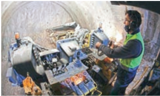
Na projektu dela 98 delavcev, od tega 83 turških.

avstrijski strani v delo uvedli že septembra 2018, medtem ko se je na naši strani najprej zapletalo z razpisi, zatem pa je izbruhnil koronavirus. Tako je začetek del sovpadel s prvim valom epidemije, izvajalec Cengiz Insaat je zato imel težave s pridobivanjem delovnih dovoljenj za delavce, njihovimi karantenami pa tudi z dovoljenjem opreme in mehanizacije. Gradnja bo predvidoma končana v letu 2025.