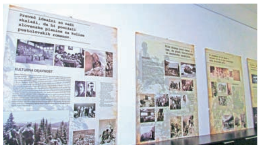
Razstava o skalaših v Slovenskem planinskem muzeju v Mojstrani

Ob jubileju skalašev so v Slovenskem planinskem muzeju v Mojstrani ponovno postavili na ogled raz-