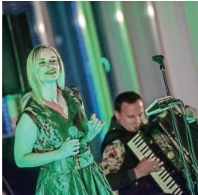
Divanhana, ena najbolj priljubljenih zasedb novega sevdaha, prihaja na Jesenice.

Med gostujočimi predstavami prihajajo Realisti (SNG Nova Gorica), ki s poplavo domisljic in songov spregovorijo o Sloveniji in so na 28. Dnevh komedije v Celju postali zlahtna komedija tako po izboru občinstva kot po izboru žirije, režiserka Tijana Zijanić pa zlahtna režiserka! Na ogled bodo