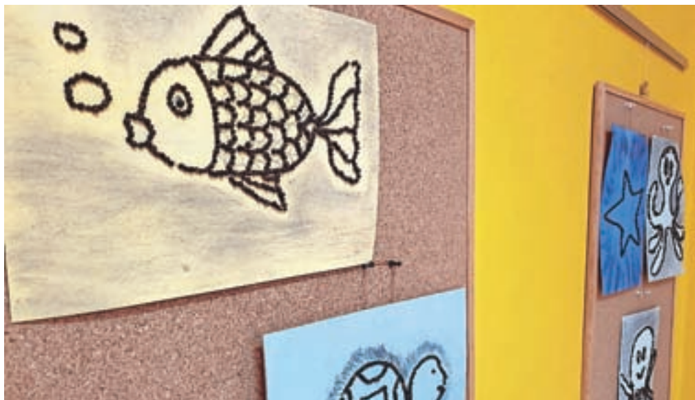
Dijaki so uporabljali kombinacijo reliefne tehnike in lepljenke naravnih materialov.

naravnih materialov. Površine so osenčili z ogljem, ki so ga dijakom podarili oglarji s Koroške Bele, ki si prizadevajo za ohranitev tradicije pridobivanja oglja," je povedala mentorica. Kot je dodala, bodo izkušnje, ki so jih pridobili na delavnici, dijakom v pomoč pri njihovem bodočem delu z otroki v vrtcu.