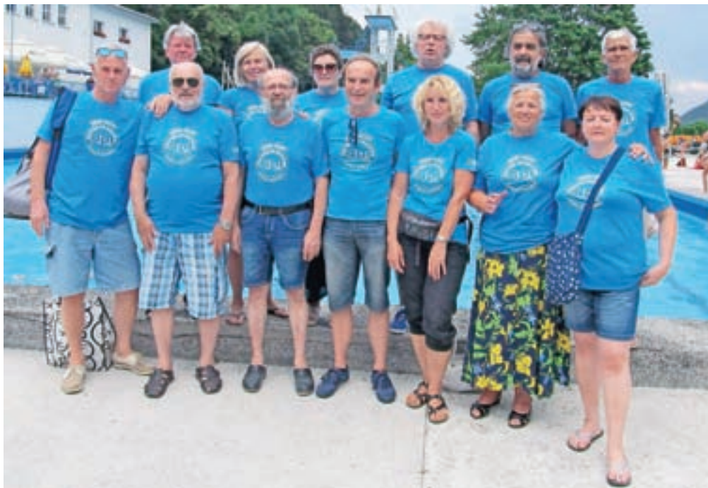
Udeleženci srečanja: nekdanji maratonski plavalci in organizatorji plavalnega maratona.

Prvi maraton je naletel na širši odmev v športni javnosti. V bivši Jugoslaviji so novico o tem z imeni plavalcev objavili kot prvo novico športnega pregleda Televizije Beograd.