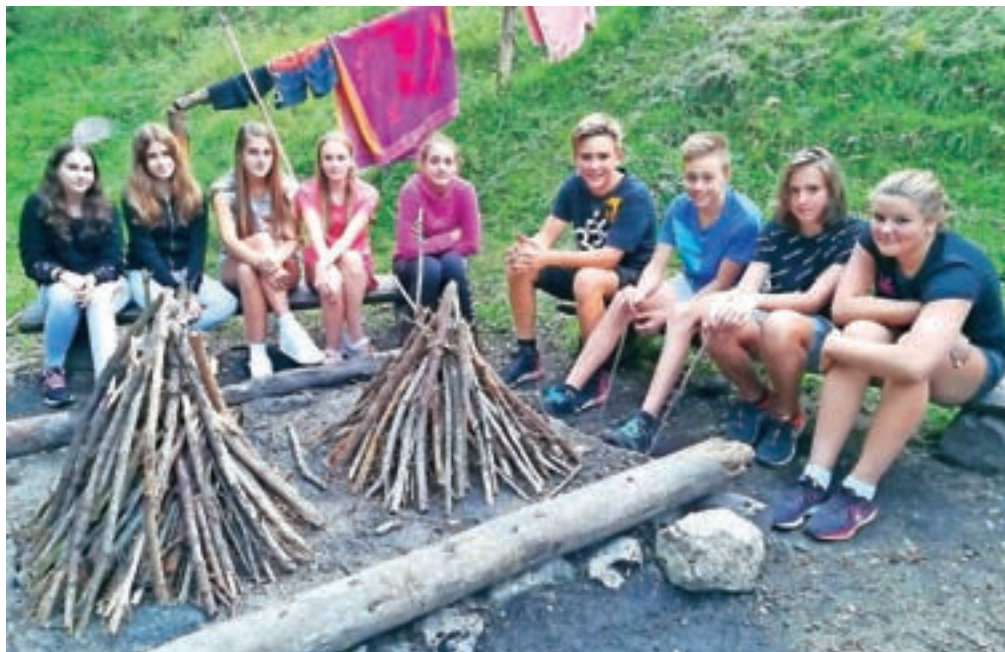
Za osmošolce z Osnovne šole Koroška Bela je bil začetek novega šolskega leta posebej zanimiv, preživeli so ga na taboru v Radovni.

Glede na lansko šolsko leto je skupno število osnovnošolcev v vseh štirih šolah nekaj večje, in sicer za 31. Vrtec Jesenice obiskuje 673 malčkov v 37 oddelkih, Glasbeno šolo Jesenice pa 440 otrok, kar je 16 več kot v lanskem šolskem letu. In koliko je dijakov v obeh jeseniških srednjih šolah? Na Gimnaziji Jesenice so vpisali 73 novincev v treh oddelkih, skupaj je na šoli 309 dijakov. Na Srednji šoli Jesenice pa imajo 168 novincev in skupaj 570 dijakov. Glede na lansko