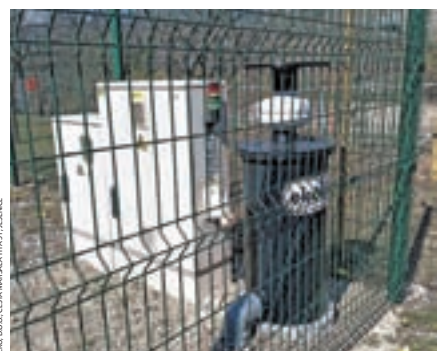
Črpališče Podmežakla s kemičnim filtrom