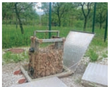
Polna košara iz črpališča