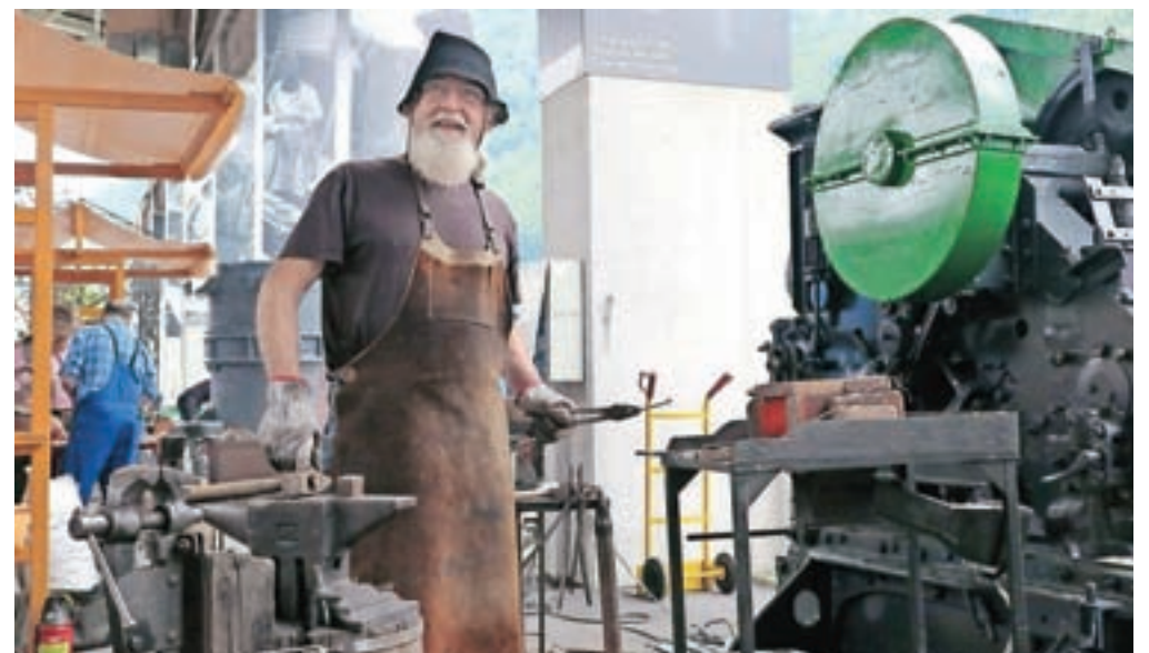
Srečanja se je udeležilo trideset kovačev iz Slovenije, Avstrije in Finske.