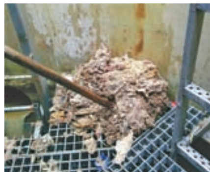
Ročno čiščenje odpadkov v črpališču