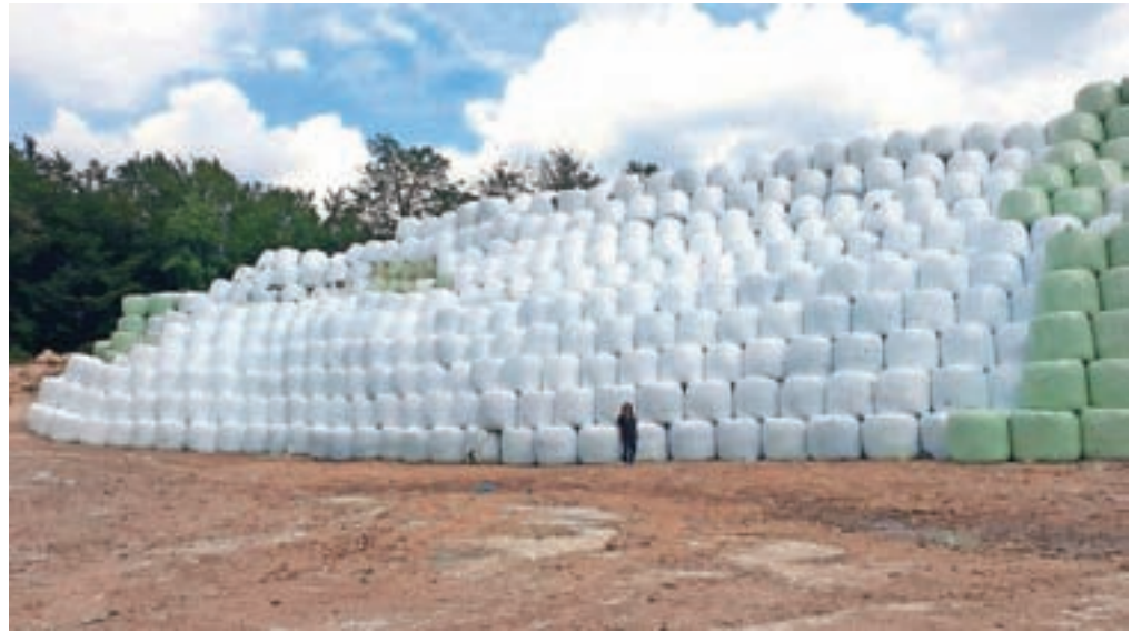
Vsa lahka frakcija je zbalirana, kar naj bi odpravilo smrad z deponije.

"Upam, da je zdaj glavni vir smradu vsaj omejen, če že ne povsem odpravljen," je dejal župan in se občanom zahvalil za potrpežljivost, saj jim je smrad neredko zelo grenil življenje. »To je zdaj dobra osnova za nadaljnje sodelovanje med Občino Jesenice in podjetjem Ekogor ter za gradnjo medsebojnega zaupanja, ki je bilo doslej načeto,« je dodal in povedal, da so na Občini Jeseni-