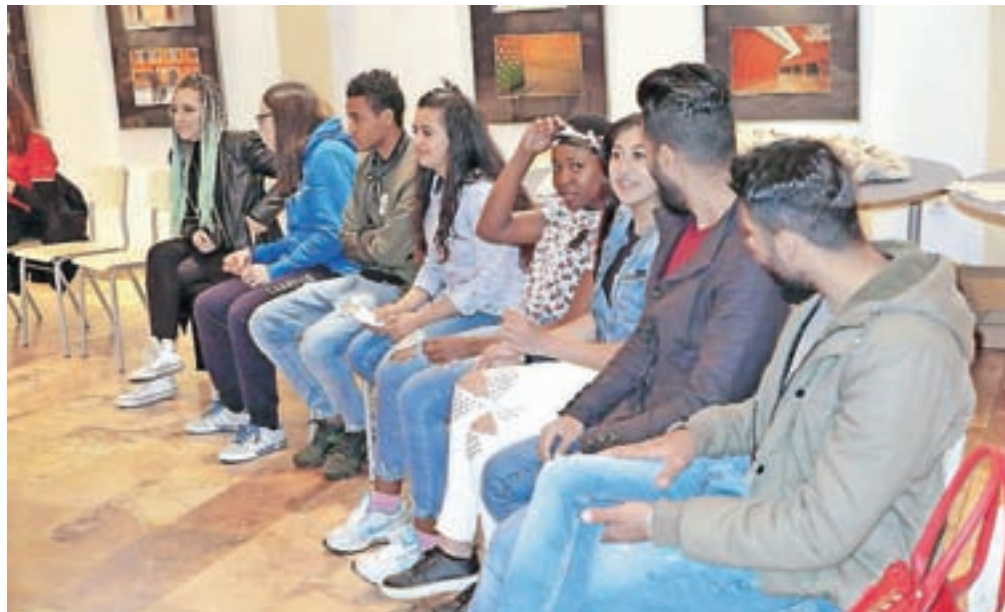
Mladi z Jesenic, priseljenci, begunci – multikulturna skupina udeležencev je razmišljala o solidarnosti.