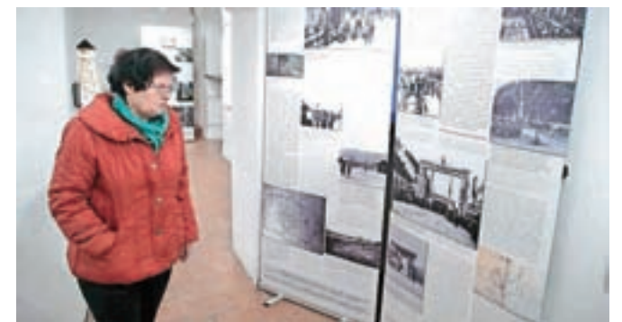
Razstava v Kosovi graščini