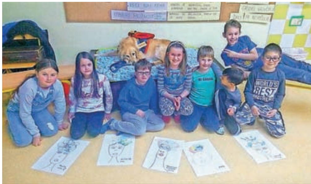
Najzabavnejša noč v šoli