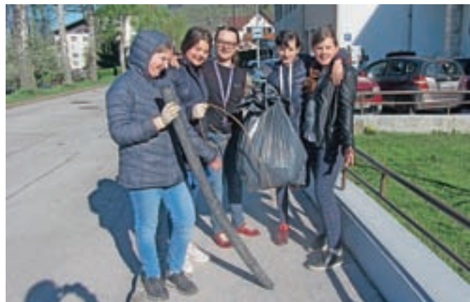
Ob dnevu Zemlje so učenci čistili okolico.

Na Osnovni šoli Koroška Bela so ob dnevu Zemlje pripravili več aktivnosti. Pri pouku so posebno pozornost namenili varstvu okolja: proučevali so globalno onesnaževanje, se čudili največjim smetiščem na planetu in ugotavljali, v kako čistem okolju živimo pri nas. Zatem so prešli od besed k dejanjem. Fantje od šestega do devetega razreda so uredili najstarejši del šole. Reciklirali so papir, kovine in uredili zbirko starih učil. Učenci od prvega do petega razreda so čistili bližnjo okolico šole, učenke od šestega do devetega razreda pa Javornik in preostali del Koroške Bele. Na podružnični šoli na Blejski Dobravi so očistili otroško in šolsko igrišče ter bližnjo okolico šole.