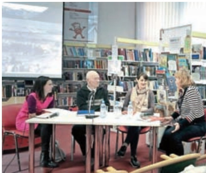
S predstavitev knjige na Jesenicah

starih koles ... Zadnji evidentirani vzpon je opravil leta 1972, po končani alpinistični poti pa je ostal dejaven kot gorski reševalec, alpinistični inštruktor, gorski vodnik in planinski predavatelj. Od leta 1964 živi na Jesenicah, kot učitelj geografije je najprej poučeval v Kranjski Gori, nekaj