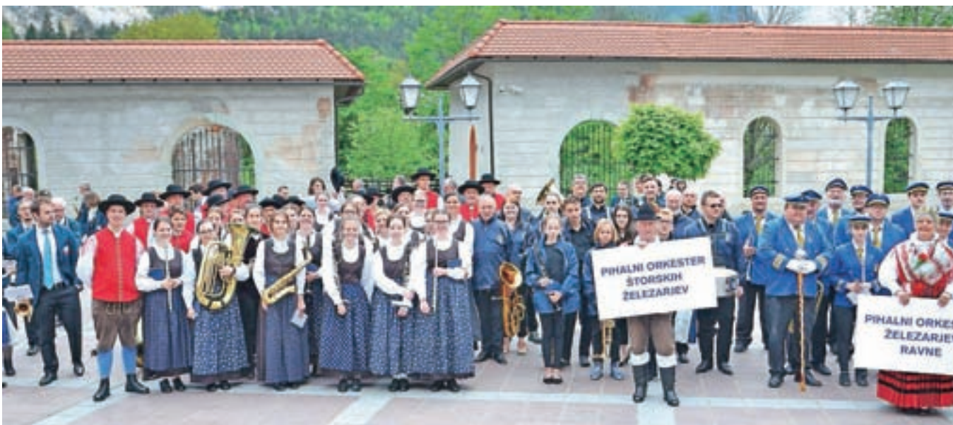
Po paradi devetih godb je tristo godbenikov na Stari Savi skupaj zaigralo.