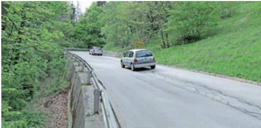
Zagotovo najtrši oreh je odsek na cesti pod naseljem Prihodi, kjer se je cestišče posedlo.