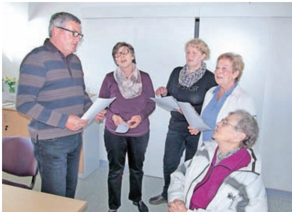
Pevski kvintet je doživeto zapel nekaj pesmi.