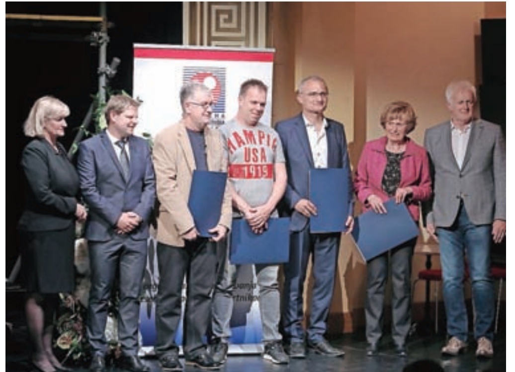
Ob jubileju so podelili priznanja članom, ki dejavnost opravljajo deset, dvajset, trideset, petintrideset in več let ter priznanja za nadaljevanje tradicije iz roda v rod.

sebnost pomembna tudi skrb za varovanje interesov obrtnikov, da jih sliši politika, ki oblikuje zakonodajo. Je pa opozorila, da bi država več pozornosti morala nameniti tudi spodbujanju mladih za obrtniške poklice in sistema vajeništva, saj zadnja leta kadra v obrti primanjkuje. Zato so v zbornici še posebej ponosni na obrtnike in podje-