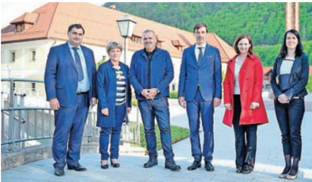
Jubilej orkestra je z obiskom počastil tudi minister za kulturo Zoran Poznič (tretji z leve), ki si je pred koncertom ogledal Staro Savo in jeseniško knjižico.

optika Berce fashion eyewear Jesenice - Lesce